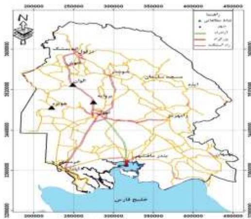
شکل ۱. نقشه موقعیت مکانهای نمونه‌برداری

و اقتصادی وارد می‌کند، بدین منظور از سه محدوده از کانون‌های بحران‌زای فرسایش بادی در استان خوزستان شامل منطقه روبروی بروایه (که خاک آن محدوده ماسه‌بادی بوده و شدت فرسایش بادی در آن به حدی است که ریشه برخی درختان در سطح خاک نمایان گردیده است) با مختصات 31^{\circ}57' عرض شمالی، 48^{\circ} طول شرقی و 31^{\circ}91' عرض شمالی و منطقه هویزه با مختصات 31^{\circ}63' عرض شمالی، 48^{\circ}9' طول شرقی (تا عمق ۵ سانتیمتری) از نقاط بدون پوشش گیاهی و از محل‌هایی صورت پذیرفت که هیچ‌گونه عارضه‌ای در مسیر جریان باد قرار نداشت. تصویر موقعیت نمونه‌برداری‌ها در شکل شماره یک نشان داده شده است. سپس نمونه‌ها به آزمایشگاه منتقل گردید.