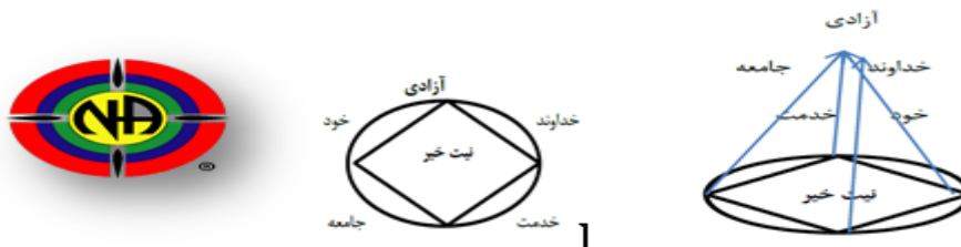
شکل (۱): نمادهای انجمن معتادان گمنام

انجمن معتادان گمنام در راستای حفظ روحیه اتحاد و همبستگی اعضای خود، دارای نمادی است که پیوند دهنده اعضا و بیانگر هدف آنهاست که به شکل زیر است: