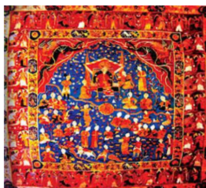
تصویر ۱: مجلس بزم بر روی پارچه ابریشمی (Bunt, 1963; 47) تصویر ۲: پارچه با نقش اسلیمی (Bunt, 1963; 34)