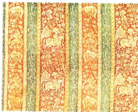
تصویر ۷: ابریشم با بافت دورو، یزد اوایل سده ۱۱ هـ.ق، از مجموعه مرحوم بانو لی لی بی بلیس (پوپ، ۱۳۸۷: ۱۰۴۶)

توجه وی تنها منحصر به نقش سنتی نشده و به سایر گرایش‌های رایج زمانه نیز توجه داشته است. موضوع قابل توجه در آثار غیاث روش ارائه تصویرسازی و ضمائم فرعی نقوش است که از ابتکارات شخصی وی محسوب می‌شود. در شیوه کار او هرگز آزادی و استقلال مشاهده نمی‌شود. از یک طرف تابع مکتب تبریز است و از طرف دیگر به شیوه مکتب اصفهان که رهبری آن با رضا عباسی بود، عمل می‌کرد. او همچنین در شیوه طراحی انتزاعی گامی بلند برداشت که حاکی از مهارت او بود.