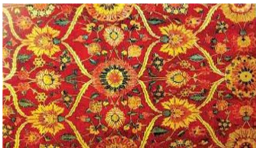
تصویر ۵: پارچه با نقش گل‌های شاه عباسی و اسلیمی، عصر شاه عباس (Bunt, 1963; 46)

یکی دیگر از ابتکارات فنی این دوره، تهیه پارچه‌های زربفت و مخمل است که در قالب جامه‌ها، آویزها و فرش‌ها ارائه می‌شود و نقوش آن به جز حیوانات و اشکال طبیعت‌گرایانه‌ی گیاهانی چون، زنبق، میخک و گل سرخ، شامل پیکره‌های انسانی (معمولاً به شیوه نقاشی رضا عباسی) نیز می‌شد. لذا بخشی از موضوعات منسوجات، تصاویر اشخاصی است که با تکلف و تصنع کشیده می‌شد مانند جوانان و دوشیزگان سرو قد و ماهر. جنبه زنانگی در تصاویر به حدی بود که تفاوت گذاشتن میان زن و مرد را دشوار می‌کرد. (ویلسن، ۱۳۶۶: ۲۴۶) از این تصاویر بیشتر در تزئین پرده‌ها استفاده می‌شد.