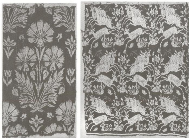
تصویر ۴: ابریشم سرمه‌ای، یزد، قرن ۱۱ (پوپ، ۱۳۸۷: ۱۰۴۰)

گران‌قیمت زری‌بافت در بازار وجود داشت و بازرگانان خارجی به راحتی می‌توانستند از میان آن‌ها، قواره‌های موردپسند خود را انتخاب کنند (تصویر ۴). عمده‌ترین محصول کارگاه‌های پارچه‌بافی دوره‌ی صفویه مخمل است که هنوز در تاریخ پارچه‌بافی کسی نتوانسته محصولی به این زیبایی بیافریند. ایرانیان مخمل‌های گل‌دار برجسته نمی‌بافتند، ولی با استفاده از بافت ریز و کم و زیاد کردن بسیار ظریف پودهای پارچه و طول گره‌ها، به قالیچه‌های مخمل، پرده‌ها و پارچه‌ها درخشش و گودی و بلندی می‌دادند. مهم‌ترین مرکز تولید پارچه‌های مخمل شهر یزد بود. یکی از اقسام معروف مخمل که بافت آن معروف بود، مخملی به رنگ عنابی سیر بود که در تزئین آن از گل‌های ساقه بلند زرد طلایی، با برگ‌های سیر استفاده می‌شد. نوع دیگر پارچه، دیباج بود که در ساخت آن از الیاف طلا استفاده می‌شد. پارچه خارا نیز نوعی پارچه ابریشمی بسیار ظریف تک‌رنگ و مشجر معروف به داماسک بود که با نقش گل و برگ بافته می‌شد. همچنین انواعی از مخمل ساده و زربفت تهیه می‌شد که از اهمیت خاص برخوردار بود (پوپ، ۱۳۷۸: ۲۳۹۱).