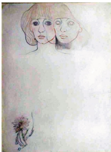
تصویر (۱۲) اثر پروانه اعتمادی