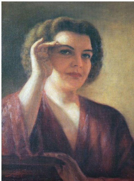
تصویر (۹) اثر شوکت‌الملوک شفاقی