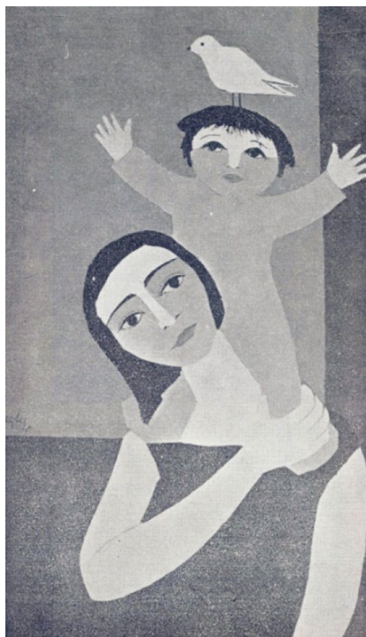
تصویر (۱۱) اثر لیلی متین دفتری