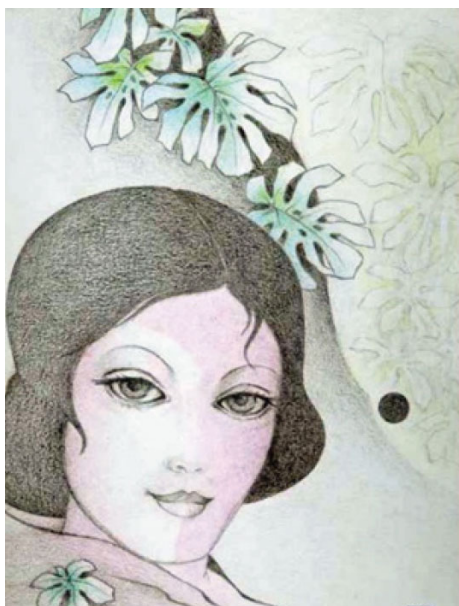
تصویر (۸) اثر طبیعه کامران