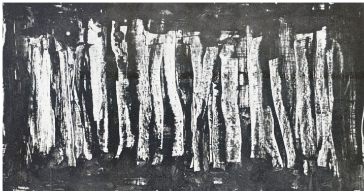
تصویر (۱) اثر بهجت صدر