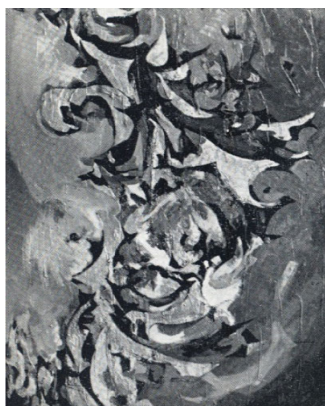
تصویر (۳) اثر منصوره حسینی