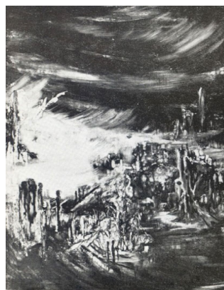
تصویر (۲) اثر ایران درودی