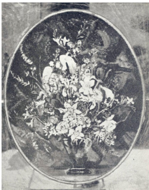
تصویر (۷) اثر منیر فرمانفرمایان