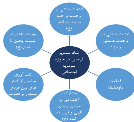
شکل ۲. مؤلفه‌های سرمایه اجتماعی شهری در ابعاد مختلف بر مبنای جریان اربعین

تنش اقوام و گروه‌های مختلف فقط زمانی توجیه‌شدنی است که سطح فعالیت‌ها و تعاملات افراد از سطح غریزه به فطرت ارتقا یابد و این اتفاقی است که در طول اربعین واقع می‌شود. در طول زیارت اربعین موضوعاتی مانند رنگ، نژاد، قومیت، حتی دین رنگ می‌بازد و نسبت افراد باهم براساس رابطه آن‌ها با امام (ع) تعریف می‌شود. مؤلفه دیگر هویت است. هویتی که در نسبت یافتن افراد با امام (ع) شکل می‌گیرد؛ این هویت هویتی اسلامی و جمعی است که افراد را به تاریخ و مظلومیت امام حسین (ع) متصل می‌شود و به وحدت یکپارچگی و همدلی منجر می‌شود.