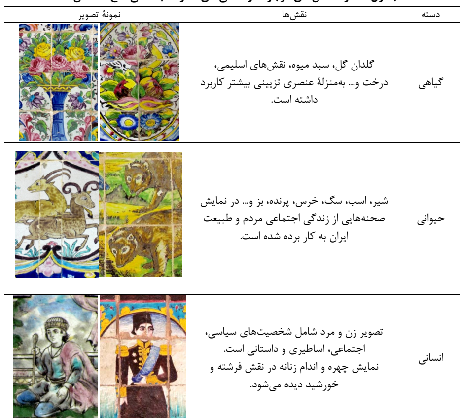
جدول ۱. نمونه نقش‌های موجود در کاشی‌های محوطه باستانی کاخ گلستان

مذهبی و ملی بودند [۱، ص ۳۰۰]. در مجموعه کاشی‌های محوطه باستانی کاخ گلستان نیز شاهد نقش‌های متنوعی از این گروه همچون نقش‌های گیاهی، جانوری، انسانی و هندسی هستیم که نقش‌های هندسی، اسلیمی و پیچک‌ها در کنار نقش گلدان‌های گل و سبدهای میوه، فرشتگان و اساطیر یا پرندگان مشاهده می‌شوند. موضوع انسان و شیوه ترسیم شخصیت‌ها بیش از دیگر نقش‌ها چشم بیننده را به خود جلب می‌کند. در جدول ۱، نمونه نقش‌های استفاده‌شده در محوطه باستانی مجموعه معرفی شده است.