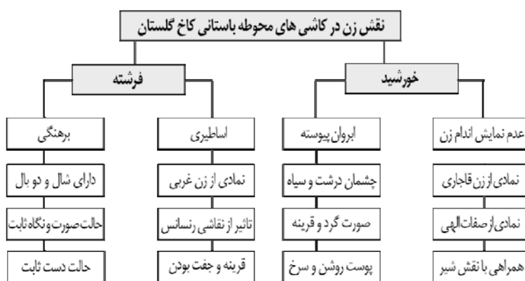
تصویر ۸. ویژگی نقش زن در قالب خورشید و فرشته، محوطه باستانی کاخ گلستان

موجودی فرازمینی و اساطیری تبدیل کرده است. تنها در یک قاب از کاشی‌ها شاهد تصویر زن با تناسبات و ویژگی انسان زمینی و غیراساطیری هستیم که در آن دو زن در چمنزار را نشان می‌دهد که در این قاب نیز نوع پوشش و ترسیم چهره دو زن همچنان تحت تأثیر هنر غرب و یادآور کارت‌پستال‌های اروپایی است. به‌طور کلی، می‌توان تصویر زن در خورشید را نمادی از زن شرقی و تصویر فرشته را نمادی از زن غربی دانست و این تلفیق هنر غرب و سنتی می‌تواند گواهی بر شرایط جامعه و دوگانگی‌های اجتماعی در پی ارتباطات میان غرب و ایران باشد که همچون کتابی مصور تاریخ قاجار را بازگو می‌کند.