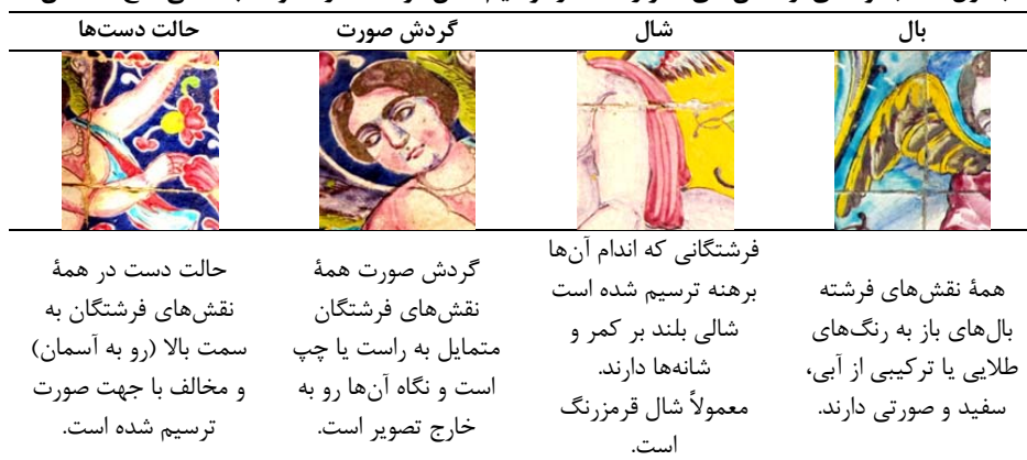
جدول ۴. مجموعه‌ای از المان‌های تکرار شده در ترسیم نقش فرشته، در محوطه باستانی کاخ گلستان

در بررسی تصویر زن در قالب فرشته، هشت نمونه از این فرشتگان بالدار بر چهار قاب از کاشی‌های محوطه باستانی کاخ گلستان و به صورت قرینه قابل مشاهده است. فقط دو نمونه از این فرشته‌ها پوشش دارند و دیگر نقش‌های فرشته به صورت برهنه و با شالی بر کمر ترسیم شده‌اند که با رنگ‌های ملایم و متمایل به صورتی و نزدیک به شمایل واقع‌گرایانه انسانی نقاشی شده‌اند. در جدول ۴، ویژگی‌های ثابت و تکرار شده در نقش‌های فرشته‌ها نشان داده شده است. رنگ‌بندی، نوع پوشش و حالات پیکره‌ها در کنار یکدیگر و استفاده از نماد بال، تصویر را به شخصیتی فرازمینی تبدیل کرده است. در همه نقش‌های موجود از فرشته، عنصر بال به صورت ثابت تکرار شده است و همچنین حالت صورت و دست‌ها نیز کاملاً مشابه با یکدیگر ترسیم شده‌اند. نوع طراحی چهره و اندام در برخی از فریم‌ها یادآور شخصیتی از یک کودک است و در برخی از نمونه‌ها تناسب یک انسان بالغ و فربه را دارد. چهره و گردش صورت به حالت سهرخ است و حالت چشم‌ها همچنان تصویری از زن شرقی و قاجاری را تداعی می‌کند. همه فرشتگان در پس‌زمینه‌ای عرفانی از گل یا آسمان قرار گرفته‌اند که حالت پرواز و رفتن به اوج را تداعی می‌کند.