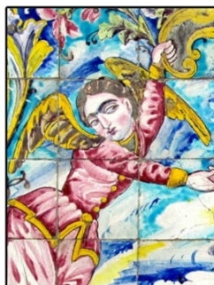
تصویر ۷. نقش اساطیری فرشته در کاشی‌های محوطه باستانی کاخ گلستان