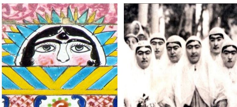
تصویر ۲. زنان ناصرالدین شاه، تصویر ۳. نقش خورشید، کاخ گلستان

تصویر زن در خورشید موجود در کاشی‌های محوطه باستانی کاخ گلستان با گیسوان و ابروهای مشکی و گاه به‌هم‌پیوسته، چشمان بادامی و درشت و صورتی سرخ‌گونه همگی الهام‌گرفته از زن شرقی است. همه نقش‌ها و جزئیات چهره به صورت قرینه ترسیم شده است. پوست سفید و گل‌انداخته، بینی پهن و دهان کوچک نیز یادآور زنان در دوران قاجار است. این شباهت در تصویر ۲ و ۳ میان عکس زنان قاجاری موجود در مرکز اسناد کاخ گلستان با نمونه نقش زن در خورشید موجود بر کاشی‌های محوطه کاخ گلستان نشان داده شده است.