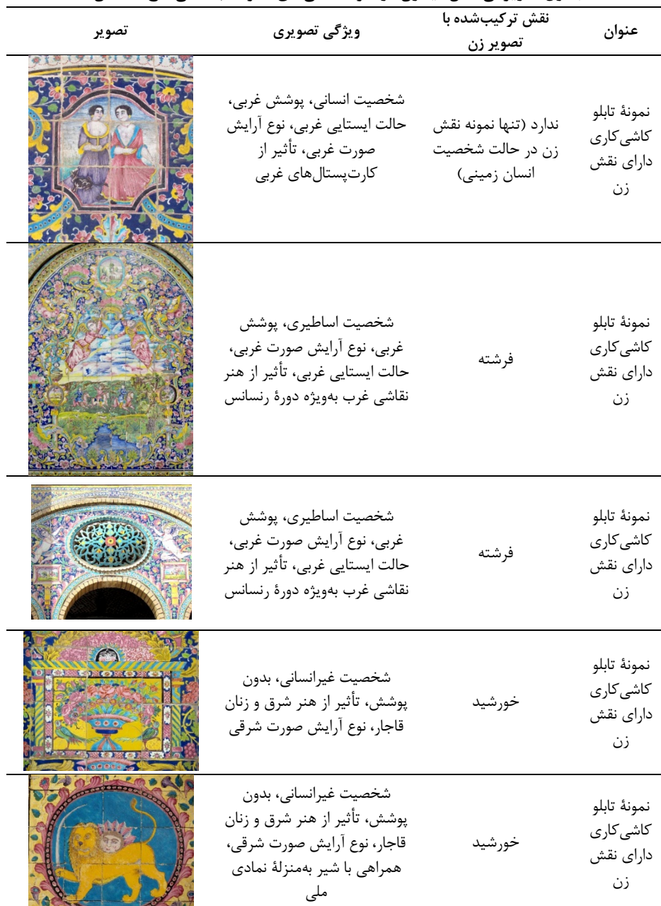
جدول ۲. ویژگی نقش‌مایه زن در نمونه کاشی‌های محوطه باستانی کاخ گلستان