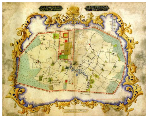
تصویر ۱. تصویری از بنای اولیه کاخ گلستان [۲۸]