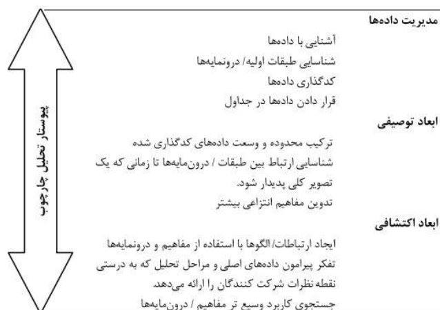
شکل ۱- رویکرد تحلیل چارچوب (Taylor, 2010)

این پژوهش دارای ۱۱ فرضیه فرعی به ترتیب در خصوص تأثیر هر یک فرایندهای مدیریتی در ابعاد ارائه و پشتیبانی خدمات فناوری اطلاعات است. تحقیقات علمی بر اساس جهت‌گیری به سه دسته تقسیم می‌شوند: تحقیق بنیادی، تحقیق کاربردی، ارزیابی. وقتی پژوهشی به قصد کاربرد عملی دانش یا به قصد کاربرد نتایج یافته‌هایش برای حل مشکلات خاص متداول درون سازمان انجام می‌شود، چنین تحقیقی پژوهش کاربردی نامیده می‌شود (سرمد و همکاران، ۱۳۸۲) و با توجه به این تعریف نوع تحقیق حاضر با توجه به هدف آن، کاربردی است. این تحقیق از دو قسمت کمی و کیفی (آمیخته) تشکیل شده و استراتژی پژوهش در مرحله کیفی، ترکیبی از مطالعه پیمایشی بوده است. رویکرد پژوهش‌های پیمایشی می‌توانند در سه سطح انجام‌پذیرند که شامل توصیف، تبیین و کشف هستند (دانایی‌فرد و دیگران، ۱۳۸۳) و در این پژوهش نیز اهداف، ترکیبی از اکتشاف، توصیف و تبیین بوده است. علاوه بر آن در این پژوهش از رویکرد تحلیل چارچوب نیز استفاده شده است که شامل شیوه‌ای معتبر برای تحلیل داده‌های کیفی می‌باشد. تحلیل چارچوب اولین بار در دهه ۱۹۸۰ توسط پژوهشگران مرکز ملی پژوهش‌های اجتماعی انگلستان به عنوان شیوه‌ای برای مدیریت و تحلیل داده‌های کیفی در پژوهش‌های کاربردی معرفی شد (Smith j, 2011). رویکرد تحلیل چارچوب، شیوه‌ای منظم در تحلیل داده‌های کیفی است که در بحث سلامت کاربرد بسیاری دارد. تیلور و همکاران با مروری بر رویکرد تحلیل چارچوب، بعد مدیریت داده‌ها، ابعاد توصیفی و ابعاد اکتشافی را برای آن در نظر گرفته (Taylor, 2010) و پیوستار آن در شکل زیر آمده است: