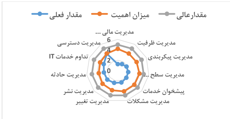
شکل ۳- تحلیل شکاف فرایندهای خدمات فناوری اطلاعات