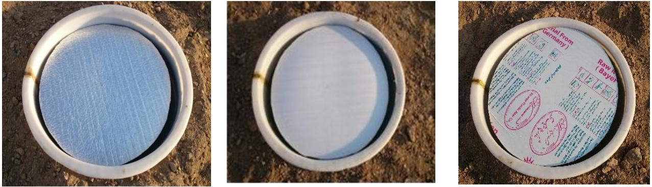
شکل ۱- پوشش‌های شناور به ترتیب از راست به چپ پلی‌کربنات، پلی‌استایرن و پلی‌استایرن با روکش آلومینیوم