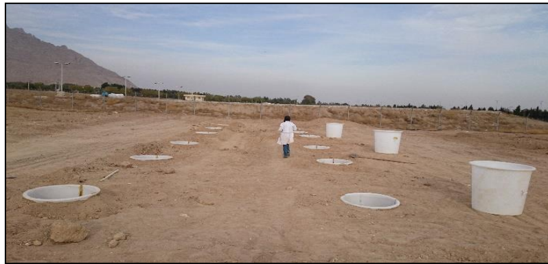
شکل ۲- جایگذاری مخازن در مزرعه دانشگاه صنعتی اصفهان