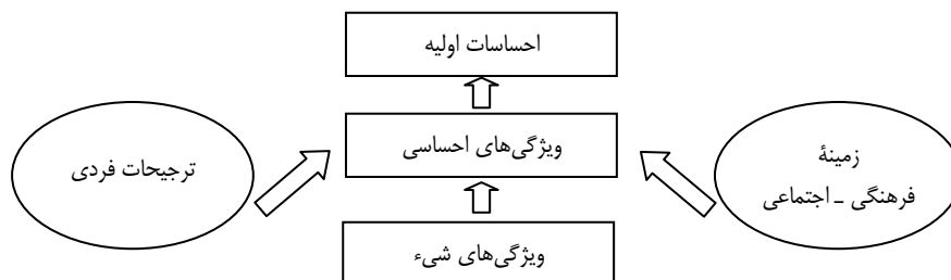
شکل ۲. مدل واکنش احساسی

رحمانیان (۲۰۱۴) در مقاله خود نقش احساس محصول و برند را بر رفتار خرید مصرف‌کننده ماکروویو (که یک کالای بادوام است) در بازار ایرانی بررسی کرده است. وی در نهایت درمی‌یابد که احساس به جای روابط خطی ساده، از طریق مؤلفه‌های پیچیده و چندوجهی، به صورت خودآگاه و ناخودآگاه بر رفتار خرید مصرف‌کننده تأثیرگذار است. بانرجی (۲۰۱۱) نیز در مقاله خود اثر نوع تبلیغات بر ذهن مصرف‌کننده، رفتار مصرف و تصمیم خرید را بررسی می‌کند و درمی‌یابد که مصرف‌کنندگان فقط به دنبال ارزش برند هستند نه ویژگی‌های محصول. بخشی از تبلیغات استفاده‌شده در این تحقیق در زمینه خودرو است، که کالایی بادوام است. بلیچلونس و همکاران (۲۰۰۹) نیز در پژوهش خود با شناسایی ویژگی‌های ظاهری که مصرف‌کنندگان برای تشخیص ظاهر لوازم خانگی بادوام استفاده می‌کنند، نحوه ادراک مصرف‌کنندگان از ظاهر محصول را بررسی می‌کنند. چاکرابارتی و گوپتا (۲۰۰۷) نیز در مقاله خود طراحی محصولات با احساسات مطلوب برای کاربران مورد نظر را کاری چالش‌برانگیز می‌دانند و تلاش دارند فرایند توسعه محصول با واکنش احساسی مطلوب را با الهام از اشیای طبیعی و مصنوعی تأیید کنند که بخشی از موارد مورد بررسی، کالای جاروبرقی به‌عنوان کالایی بادوام است. همچنین ایشان یک مدل واکنش احساسی ۱ را در تحقیق خود ارائه می‌کنند که این مدل در شکل ۲ نمایش داده شده است.