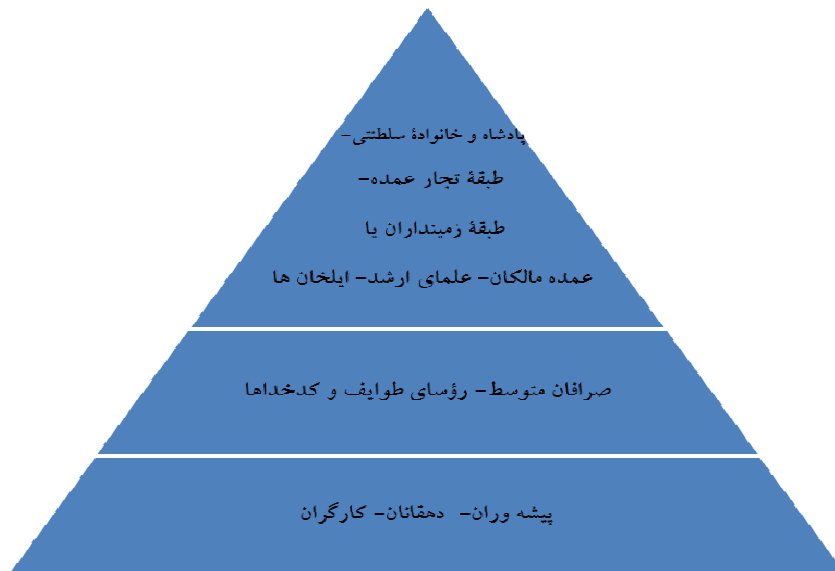
شکل ۲. هرم طبقاتی ایران در نیمه دوم قرن نوزدهم