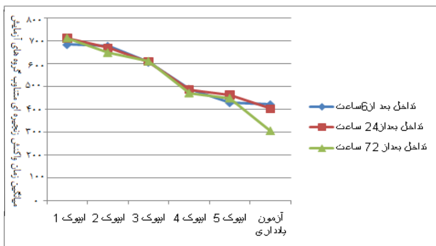
شکل ۱. روند عملکرد سه گروه آزمایشی در پنج بسته تمرینی مرحله اکتساب و بسته یادداری

اثر اصلی بسته تمرینی ( F(4, 228) = 159/65, P = 0/001 ) معنادار است. به منظور تعیین محل تفاوت‌ها در بین بسته‌های تمرینی در مرحله اکتساب از آزمون تعقیبی بونفرونی استفاده شد. نتایج آزمون تعقیبی بونفرونی نشان داد تفاوت اختلاف میانگین زمان واکنش زنجیره‌ای در توالی تصادفی و تکراری از بسته اول به بسته‌های دوم، سوم، چهارم و پنجم، از بسته دوم به بسته‌های سوم، چهارم و پنجم، از بسته سوم به بسته‌های چهارم و پنجم معنادار است. بررسی آماره‌های توصیفی در شکل ۱ نشان می‌دهد که روند عملکرد آزمودنی‌ها طی افزایش کوشش‌های تمرینی، پیشرفت می‌کند و آزمودنی‌ها در بسته پنجم نسبت به سایر بسته‌های تمرینی عملکرد بهتری داشتند ( P < 0/001 ). شکل ۱ بیانگر مقایسه عملکرد ۳ گروه آزمایشی در شاخص میانگین نمره‌های زمان واکنش زنجیره‌ای آزمودنی‌ها در پنج بسته تمرینی در جلسه اکتساب مهارت است.