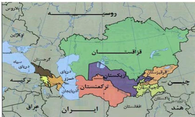
نقشه ۲. موقعیت ژئوپلیتیکی کشورهای آسیای مرکزی در هم‌جواری با ایران