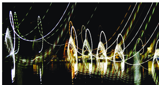
عکس ۲- مارسیا اسمیلاک، صدای زنگ تلفن، ۱۹۹۵. شنیدن رنگی هنرمند. ماخذ: (Cytowic & Eagleman, 2009, 46)