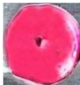
برنامه ورزشی (ب)

شکل ۲. مرحله بعد از قرار دادن در محلول TTC که نواحی سفیدرنگ نواحی INF و نواحی قرمز رنگ نواحی غیر INF است. گروه کنترل (الف) گروه برنامه ورزشی (ب)