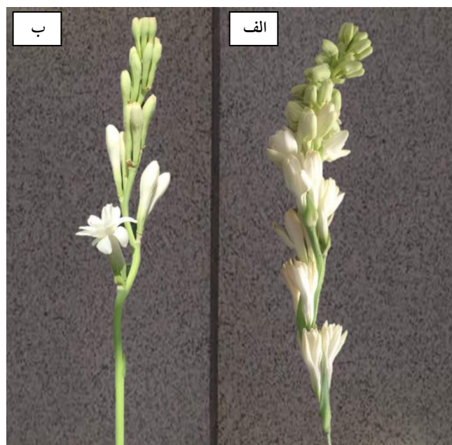
شکل ۳. گلچه‌های گل مریم تیمار نمونه ۲۰ درصد قارچ تریکودرما (الف) و نمونه شاهد (ب)

اثر ساده سطح تنش و سطح قارچ تریکودرما با سطح اطمینان ۹۹ درصد بر صفات تعداد گلچه باز شده و قطر گلچه معنی دار شد (جدول ۱). با افزایش سطح تنش تعداد