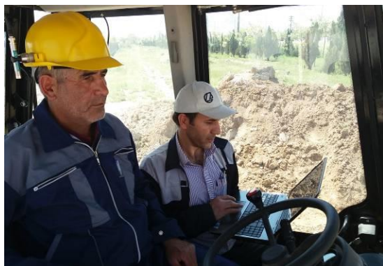
شکل ۱. بکهو لودر (راست) و میکروفن اندازه‌گیری در موقعیت گوش کاربر (چپ)

موقعیت گوش کاربر انجام گرفت. برای این منظور، میکروفن با فاصله ۱۰۰ میلی‌متر نسبت به گوش راست کاربر قرار داده شد که در شکل (۱) نشان داده شده است.