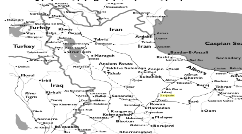
نقشه ۲: مسیر تجاری جاده ابریشم در نواحی مرکزی آسیا و ایران

«ساوه همدان» و «ساوه اصفهان» تقسیم می‌شد (رک. قمی، ۱۳۶۱: ۵۷). اغلب بلوکات، رودها، قنات‌ها، دریاچه‌های باستانی و زمین‌های حاصلخیز نواحی شرقی همدان نیز در طول همین مسیر قرار داشتند (رافعی، بی‌تا/۱: ۴؛ ابن‌القیه، ۱۴۱۶: ۵۶۰؛ ۲۰۱۵: ۱۷۲-۱۷۳ Tucker). در سمت غربی این مسیر، یعنی در امتداد آن به سمت کنگاور و کرمانشاه، دشت تاریخی بهار قرار گرفته بود که آن نیز از لحاظ تاریخی و ژئوپولیتیکی حائز اهمیت بوده است (رک. اذکاتی، ۱۳۸۰: ۱۲۱-۱۲۹). طول این مسیر در منابع متفاوت آمده؛ ایسیدور خاراکسی حد فاصل همدان تا ری را ۵۸ فرسنگ (ایسیدور خاراکسی، ۱۳۸۷: ۲۷) و اصطخری با اندک تفاوتی آن را شصت فرسنگ دانسته: «اول از همدان تا به شهر ساوه سی فرسنگ، از ساوه تا ری نیز سی فرسنگ می‌باشد» (اصطخری، ۱۳۷۳: ۱۰۲). مقدسی نیز در احسن التقاسیم مسیر همدان تا بوزنجر در شمال همدان را یک مرحله و ابن‌فضلان مسافت زمانی همدان تا ساوه را دو روز راه دانسته است (مقدسی، ۲/۱۳۶۱: ۶۰۱؛ ابن‌فضلان، ۱۴۱۳: ۷۵). به گفته بارتولد، نزدیکترین مسیر بین همدان و ری ۴۹ فرسخ بوده که این مسیر از خارج از شهرها می‌گذشته و مسیری فرعی بوده که در منابع نیز کمتر بدان اشاره شده است (بارتولد، ۱۳۵۸: ۱۵۳). اما مسیر اصلی همان مسیر شصت‌فرسخی بوده که اصطخری و ابن‌حوقل و دیگر مورخان اسلامی بدان اشاره کرده‌اند (اصطخری، ۱۳۷۳: ۱۰۲؛ ابن‌حوقل، ۱۳۶۶: ۱۰۳-۱۰۴).