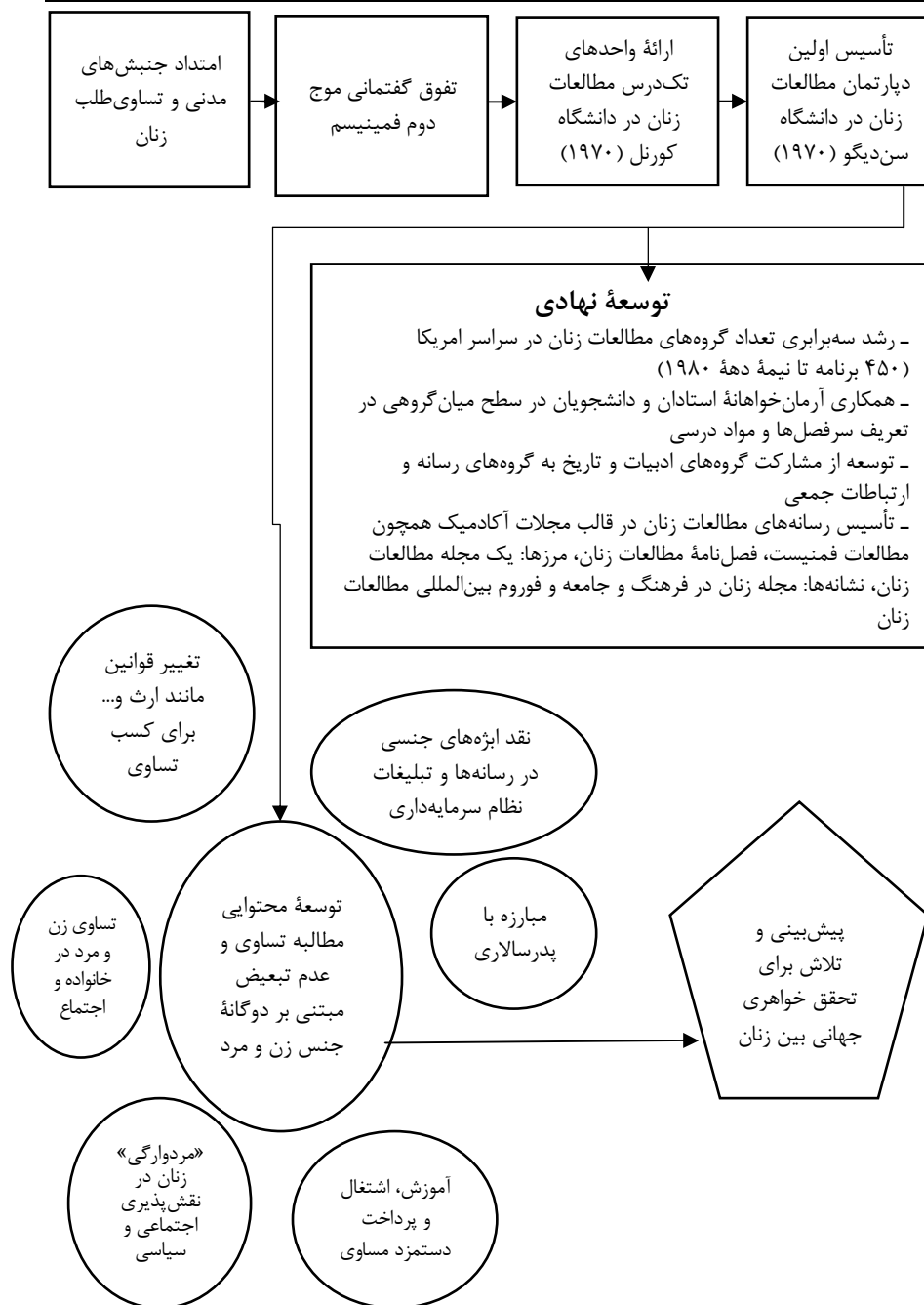
نمودار ۱. پارادایم سیستم جنسیت دوگانه ۱۹۷۰- اوایل دهه ۱۹۸۰