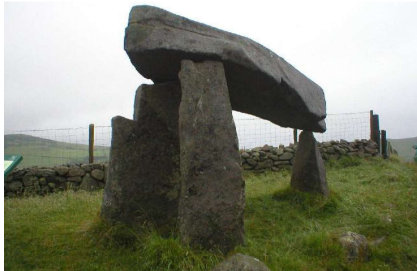
تصویر شماره ۱. دلمنی بر پایه منهیر

سنگهایی برای دلمن استفاده می کردند که قبلا برای بنای آرامگاه بریده شده بودند. فرض دوم اینکه، برخی از گونه های آیینی، سازندگان دلمن را وادار می ساخت تا منهیرها را جابجا کرده و داخل بنای جدیدی به نام دلمن به کار گیرند. فرضیه دیگر نیز چنین است که دلمن ها دقیقا در همان جایی ساخته می شدند که منهیرها در آنجا بنا شده بود. از همین رو، این بنا تبدیل به دلمن می شد و بدین ترتیب تقدس بنا حفظ می شد. شاید تمامی فرضیات درست باشند (اولیویرا، ۲۰۱۱: ۸۰).