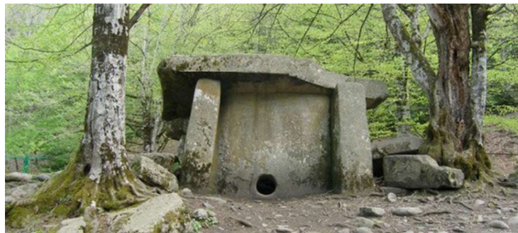
تصویر شماره ۲- دلمن حفره دار

در اغلب دلمن‌ها حفره ای در یکی از لوحه های سنگی حفر شده که بنا به عقیده اغلب دانشمندان این حفره ها اختصاص به مرده داشت. دیگر دانشمندان حدس می زنند که چنین حفره ای به جهت روح مرده بوده تا در فرصت مناسب بتواند از بدن خارج شود. به نظر می رسد که برخی یادمان های سنگی ایستاده در برخی فرهنگها، نمادی از پرستش نیاکان بوده باشند. در برخی جاهایی که مجموعه عظیمی از چنین سنگهای یادمان وجود دارد، مردمان محلی هنوز هم بدانها با شیوه ای روحانی احترام گذاشته و یا آنها را به گورستانهای جدید منتقل می کنند. چنین تصور می شود که این کار برای ارتباط با مردگان از طریق چنین سنگهای یادمانی می باشد (گاری، ۲۰۰۴: ۸۷). شایان ذکر است که در برخی از مذاهب، پا عضو خاصی از بدن است که روح در آن قرار دارد. اما صرف نظر از این اعتقادات می توان ایجاد حفره ها در دلمن‌ها را جهت استفاده از نور خورشید برای کسانی که در آن زندگی می کردند و در واقع نوعی پنجره های اولیه خطاب کرد.