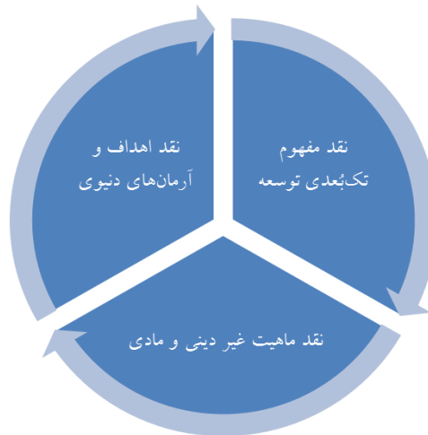
ابعاد نقد الگوهای غربی توسعه در نگاه حضرت آیت‌الله خامنه‌ای

ایشان در جای دیگری درباره پیشرفت در اسلام معتقدند: «البته پیشرفت مادی مطلوب است اما به‌عنوان وسیله. هدف رشد و تعالی انسان است. پیشرفت کشور و تحولی که به پیشرفت منتهی می‌شود، باید طوری برنامه‌ریزی و ترتیب داده شود که انسان بتواند در آن به رشد و تعالی برسد؛ انسان در آن تحقیر نشود. هدف، انتفاع انسانیت است. نه طبقه‌ای از انسان، حتی نه انسان ایرانی. پیشرفتی که ما می‌خواهیم براساس اسلام و با تفکر اسلامی معنا کنیم، فقط برای انسان ایرانی سودمند نیست، چه برسد بگوئیم برای طبقه‌ای خاص. این پیشرفت، برای کل بشریت و برای انسانیت است. نقطه تفاوت اساسی، نگاه به انسان است.» (بیانات در دیدار دانشجویان دانشگاه مشهد، ۱۳۸۶).