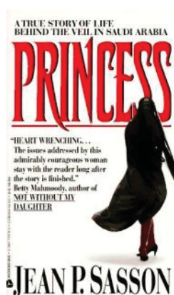
تصویر ۱- طرح جلد ۱۹۹۲

منظور کاهش آلام آنها بلکه صرفاً از جنبه‌ بشر دوستانه جهانشمول آن (لیوون و جوئیت، ۱۲۵). بنابراین آنچه از طریق این طرح‌جلد در ذهن مخاطب رقم خواهد خورد حفظ انگاره‌ دوگانه «زن غربی/زن شرقی»- به تبع «غرب/شرق»- و ایجاد نوعی خوش‌بینی نسبت به وضعیت حقوق زن در غرب است؛ به دیگر سخن، آنچه بیش از پیش در این طرح‌جلد خودنمایی می‌کند ایجاد نوعی "برتری اخلاقی" و توهم برتری‌جویانه است که به سسون این فرصت را می‌دهد که جایگاه خود را در ابتدای «صف تاریخ بشری» تحکیم کند؛ به این معنا که در تقابلی که بین زن شرقی و سسون در ذهن خواننده شکل می‌گیرد سسون در دید خواننده به منزله‌ زنی روشنفکر، مستقل و خودآگاه مجسم می‌شود که برخلاف زن سوژه‌ تصویربر روی بدن خویش کنترل دارد. به علاوه نویسنده با خلق «تفاوت‌هایی» از این نوع بین آنچه آشنا و «غریب» ۱ است تمایز ایجاد می‌کند و "خواننده سفیدپوست را قانع می‌نماید که قرار است در متن با اقوام و سرزمین‌هایی روبه‌ رو شوند که به قدر کفایت ناآشنا هستند" (لیزل، ۲۷۲). نتیجه‌ اعمال این منطق «تشابه و تفاوت»، از یک سو، تثبیت جایگاه نویسنده به منزله‌ سوژه آگاه و فرهیخته (در مقابل شرقی غیرتمدن) است که چون والدی مهربان نگران و ناراحت سرنوشت شوم «خواهران جهانی» خویش است. (همان، ۸۵). از دیگر سو، پررنگ کردن این تفاوت‌ها از سسون چهره‌ای قهرمان‌گونه می‌سازد، شوالیه‌ای دلیر که در راه نجات «خواهران جهانی» خود ناگزیر از نبردی سخت علیه عقب‌ماندگی و خرافه‌محوری حاکم بر مشرق‌زمین است.