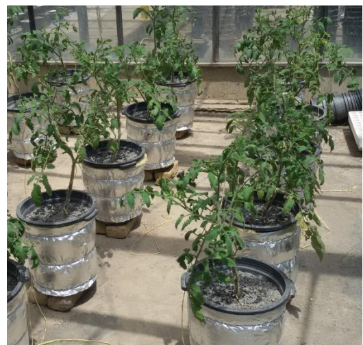
شکل ۱. نمایی از گلدان‌های مورد استفاده در طرح

قالب طرح کاملاً تصادفی در سه تکرار و پنج تیمار بر روی گیاه گوجه‌فرنگی رقم CH فلات اجرا شد. آزمایش‌ها در سال ۱۳۹۳ در گلخانه پژوهشی دانشکده کشاورزی دانشگاه فردوسی مشهد انجام شد. برای کاشت گیاه از گلدان‌های پلاستیکی به قطر بالای 30 سانتی‌متر و قطر پایین 24 سانتی‌متر و ارتفاع 35 سانتی‌متر استفاده شد. در هر گلدان یک گیاه کاشته شد. برای حذف تبخیر از سطح گلدان‌ها، سطح آن‌ها با لایه‌ای از گراول پوشانده شد. در طول فصل رشد با آفات مگس مینوز و مگس سفید با کاربرد سموم مناسب مبارزه شد. تا مرحله گلدهی هیچ‌گونه تنشی به گیاه وارد نشد و آبیاری با دور زمانی سه روز انجام شد. روز قبل از آبیاری همه گلدان‌ها وزن شدند و مقدار آب آبیاری با توجه به ظرفیت گلدان در ظرفیت زراعی (FC) تعیین گردید. برای تعیین ظرفیت زراعی ابتدا گلدان‌ها اشباع شدند. همچنین سطح گلدان با پلاستیک پوشانده شد. برای تعیین وزن گلدان‌ها در ظرفیت زراعی، گلدان‌ها اشباع و اجازه داده شدند تا 48 ساعت زهکشی انجام شود. بعد از این مدت گلدان‌ها با ترازوی دیجیتالی با دقت یک‌صدم گرم وزن شده و این وزن به عنوان وزن گلدان‌ها در FC در نظر گرفته شد. تیمارهای آبیاری از مرحله گلدهی تا میوه‌دهی اعمال شد. از این مرحله به بعد وزن هم‌گلدان‌ها هر روز (در یک ساعت مشخص، حدود ساعت 21 ) با یک ترازوی دقیق اندازه‌گیری شد. تیمارهای اعمال شده شامل 120 ، 100 ، 80 ، 60 و 40 درصد نیاز آبی بود. بدین ترتیب از تیمار 120 درصد نیاز آبی برای محاسبه جذب پتانسیل، از تیمار 100 و 80 درصد نیاز آبی برای واسنجی مدل‌ها و از تیمارهای 60 و 40 درصد نیاز آبی برای صحت-سنجی مدل‌ها استفاده گردید. در شکل (۱) نمایی از گلدان‌های طرح نشان داده شده است.