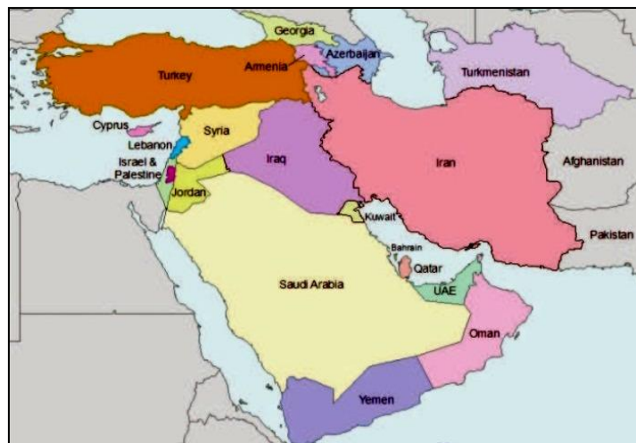
شکل ۱. آسیای جنوب غربی، پیوندگاه سه قاره