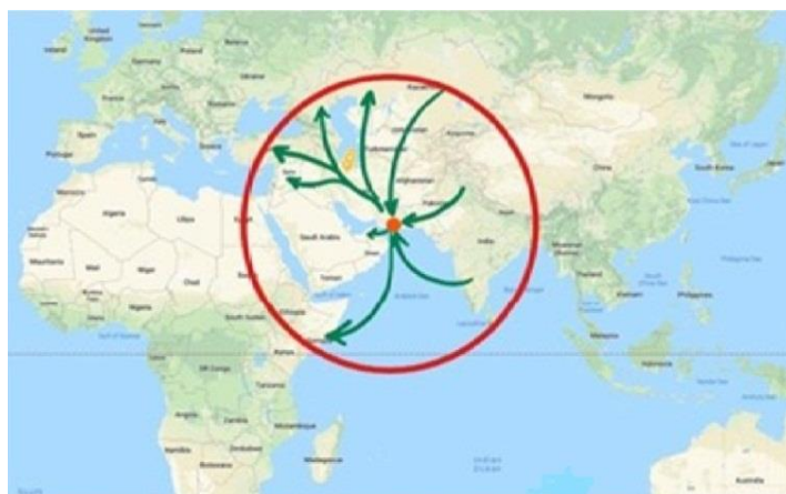
شکل ۴. چابهار، کانون اتصال سه قاره آسیا، اروپا و آفریقا

کوهن از اکیومنی دیگری در خلیج فارس یاد می‌کند که عربستان را به بحرین متصل می‌کند و بخش‌هایی از دو منطقه میانی و بیابان جنوبی را دربرمی‌گیرد. این ناحیه از ریاض در بیابان داخلی تا ساحل مراکز سعودی الدمام و الجبیل را پوشش داده است و از آنجا به مجمع‌الجزایر بحرین می‌رسد (همان: ۶۸۶ - ۶۸۷)، اما با فعال شدن دو ناحیه پیش‌گفته، آینده ناحیه ریاض منامه در گرو نحوه تعامل با این دو ناحیه است. ناحیه یکپارچه دیگری که از جاسک و چابهار ایران تا گوادر پاکستان امتداد دارد، یک ذخیره راهبردی و چهارراهی است که می‌تواند در کنار دو اکیومنی منطقه‌ای دیگر به کانون ارتباط دریایی، زمینی و هوایی جنوب و جنوب غربی آسیا با سایر حوزه‌های ژئوپلی‌نومیک و پیوندگاه اقتصاد سیاسی منطقه با اقتصاد سیاسی جهانی تبدیل شود. سکوت کوهن درباره این ناحیه قابل تأمل به نظر می‌رسد.