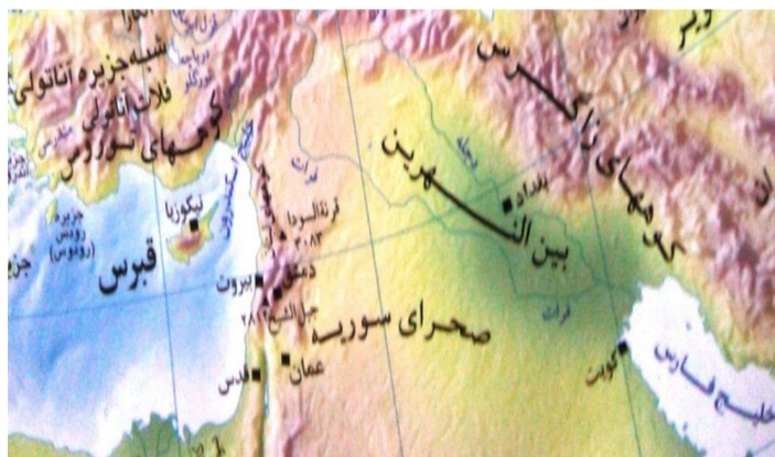
شکل ۳. نمایی مشترک از موقعیت منطقه‌ای اکیومنی‌های رأس خلیج فارس و خلیج اسکندرون

مجموعه یکپارچه فراملی دیگر، خلیج اسکندرون است که در محل تلاقی رودخانه نهرالعاصی به دریا، دو کشور سوریه و ترکیه را با یکدیگر پیوند می‌دهد. لاذقیه مهم‌ترین بندر سوریه و حلب دومین شهر بزرگ و مهم‌ترین شهر تولیدی این کشور، در مجاورت استان ختای ترکیه قرار دارند. انطاکیه (مرکز استان ختای) و اسکندرون مراکز شهری مهم ختای هستند. از این منطقه تمرکز جمعیتی به سمت غرب و در امتداد مرکز تولیدی ترکیه یعنی آدانا پیش می‌رود. این منطقه که در شرایط سیاسی متفاوت ممکن بود به یک اکیومنی متحد تبدیل شود، شبکه‌ای از بندرها، بزرگراه‌ها و راه‌آهن دارد که به ترکیه، سوریه و عراق منشعب شده‌اند (کوهن، ۱۳۸۷: ۶۸۶).