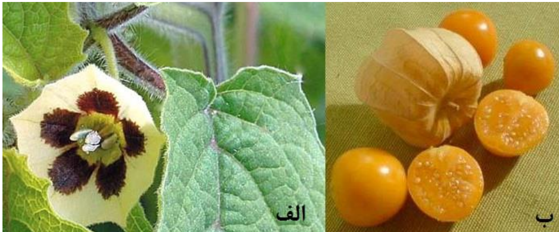
شکل ۱. الف) مرحله گلدهی (ب) مرحله میوه‌دهی