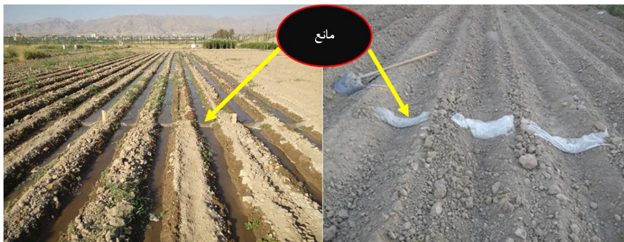
شکل ۱- نمایی از چویچه‌های آزمایشی و موانع ایجاد شده در آن

شیب چویچه‌ها برابر ۰/۹۶ درصد به دست آمد. در تمام آزمایش‌ها، هر سه چویچه آبیاری شدند و اندازه‌گیری‌ها در چویچه وسط انجام شد. چویچه‌های کناری به عنوان چویچه‌های محافظ و برای در نظر گرفتن اثر حاشیه‌ای و ایجاد شرایط واقعی، لحاظ شدند. چویچه‌ها انتها باز در نظر گرفته شدند. در این تحقیق، برای اندازه‌گیری دبی جریان ورودی و رواناب خروجی از چویچه‌ها، از فلوم