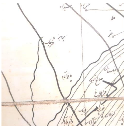
تصویر ۱. برگرفته از نقشه عبدالرسول مهندس اصفهانی

یکی از نقشه‌های منتشر نشده مهندس بغایری، نقشه امین‌آباد ورامین در حوالی قرچک است که تاریخ ترسیم آن شوال ۱۳۳۶ است (سازمان ...، اسناد متفرقه، بی‌شماره). ظاهراً، این امین‌آباد نسبت به امین‌آبادهایی که در محدوده تهران وجود دارد جوان‌تر از بقیه است، چراکه در «نقشه بعضی بلوکات دارالخلافة تهران» که عبدالرسول مهندس اصفهانی در سال ۱۲۸۰ ق/۱۸۶۴ م ترسیم کرد، (شیرازیان، ۱۳۹۵، ص ۲۰؛ سلطانی، ص ۱۱۷-۱۳۴) امین‌آبادی در حوالی قرچک وجود ندارد (نک. تصویر ۱).