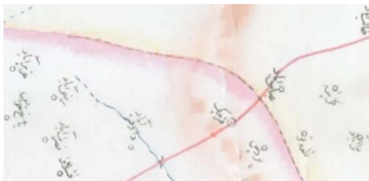
تصویر ۴. برگرفته از اولین نقشه بغایری

حال آنکه در روی دیگری با خطی متفاوت نام «امین‌آباد» در حدفاصل «پردیس- مافی‌آباد»، و البته به اشتباه در «شرق قرچک» مشخص است (همو، ۱۳۹۵، ص ۸۳) (تصویر ۵).