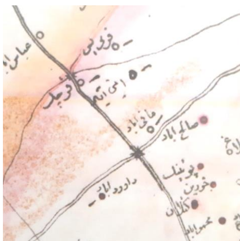
تصویر ۵. برگرفته از دومین نقشه مهندس بغایری

حال آنکه در روی دیگری با خطی متفاوت نام «امین‌آباد» در حدفاصل «پردیس- مافی‌آباد»، و البته به اشتباه در «شرق قرچک» مشخص است (همو، ۱۳۹۵، ص ۸۳) (تصویر ۵).