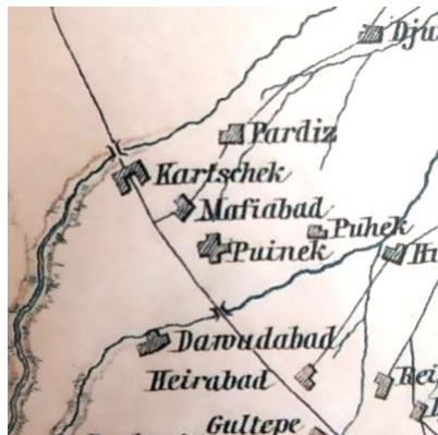
تصویر ۲ برگرفته از نقشه اشتال

در «نقشه تهران و نواحی» در سال ۱۳۲۸ ق که اثر احمد بن سلیمان در ۱۳۲۸ نیز در آن محدوده «امین‌آباد»ی وجود ندارد (همو، ص ۸۶).