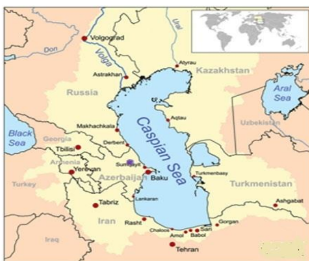
تصویر ۱: مراکز تجاری ۱

اطراف دریای خزر نیز همچون دیگر نواحی ایران دستخوش آشوب و ویرانی می‌شد، ولی باید توجه داشت که موقعیت استراتژیک این شهرها و ولایات خود عاملی برای بهبود اوضاع و به دنبال آن گسترش فعالیت‌های بازرگانی بود. در این بخش به ولایات و مراکز تجاری، که در روند تجارت نقش داشتند، پرداخته خواهد شد.