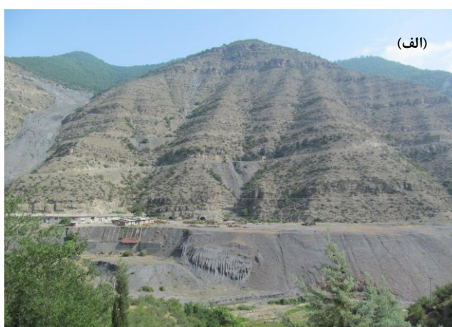
شکل ۱. تصاویر باطله‌های زغال سنگ در معادن کارمزد سوادکوه (الف) و کیاسر ساری (ب)

سپس نمونه‌ها به گلخانه انتقال و در شرایط طبیعی در داخل ظروف پلاستیکی بر روی لایه نازکی از خاک استریل به ضخامت ۳ الی ۵ سانتی‌متر کشت داده شدند. دمای گلخانه در محدوده ۱۸ تا ۳۰ درجه سانتی‌گراد و تحت آبیاری منظم بوده است. تعدادی ظرف که تنها شامل ماسه ضد عفونی شده بودند به عنوان شاهد در گلخانه قرار گرفته تا بذور پراکنش یافته از محیط اطراف شناسایی و از داده‌ها حذف شوند. نمونه‌ها به مدت هشت ماه در گلخانه آبیاری شدند و تمامی بذره‌های جوانه زده شناسایی شده و یا در صورت عدم شناسایی در مرحله گیاهچه به ظروف بزرگتری انتقال تا پس از رشد کافی