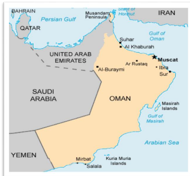
نقشه ۱.

عمان و امارات نیز مانند سایر کشورهای عربی حوزه خلیج فارس دارای اختلافات مرزی و سرزمینی‌اند. امارات بین دو قسمت شمالی و جنوبی عمان جدایی انداخته است (نقشه ۱). عمان خواهان راهی است که آن کشور را به شبه‌جزیره مسندم از طریق فجیره ۱ و شارجه ۲ متصل کند؛ درحالی‌که امارات مخالف این درخواست عمان بوده و این مخالفت سبب درگیری مسلحانه بین دو کشور در سال ۱۹۷۹ گردید و دو کشور تا مه ۱۹۹۱ از هرگونه روابط کامل دیپلماتیک خودداری کردند. البته، عمان با دریافت کمک مالی سالانه از امارات متحده عربی، ادعاهای ارضی خود را مسکوت گذاشت و با برقراری روابط سیاسی و سفر متقابل سران دو کشور اختلافات موجود شدیداً کاهش یافت. باوجوداین، اختلافات بین عمان و امارات در شبه‌جزیره مسندم به‌صورت یک منبع تنش بلندمدت درآمده است؛ به‌گونه‌ای که در ۸ نوامبر ۱۹۹۲ بین دو کشور بر سر منطقه مسندم برخورد نظامی صورت گرفت و چند نفر از افراد دو کشور کشته شدند. دو کشور از تبادل سفیر خودداری کردند تا اینکه در سال ۱۹۹۹ در خصوص مرز آن‌ها توافقی صورت گرفت (جعفری ولدانی و جعفری ولدانی، ۱۳۹۱: ۸۷-۹۳). دویارگی و دو بخش بودن قلمرو عمان و فقدان راه زمینی مستقل بین سرزمین اصلی عمان و شبه‌جزیره مسندم، در صورت بحران، می‌تواند مانعی بر اعمال حاکمیت رژیم عمان بر این منطقه باشد (همان‌طور که در پاکستان پیش آمد و بخش شرقی آن، بنگلادش، از آن جدا شد). به خاطر جدایی سرزمینی چنانچه در شرایطی خاص قدرت‌های خارجی حاکمیت عمان را بر بخش جنوبی تنگه هرمز به مصلحت خود ندانند، به‌راحتی می‌توانند وسیله جانشین این بخش از سرزمین عمان را فراهم آورند. به‌خصوص در صورتی که رژیمی مخالف با منافع این قدرت‌ها در این کشور زمام امور را در دست گیرد (پولاب، ۱۳۹۸).