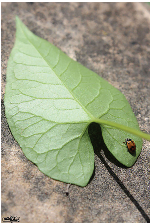
ارسالی: زهره کاظمی