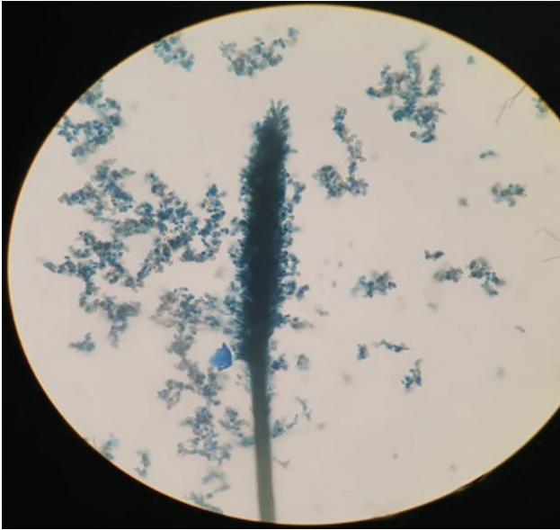
اندام کنیدیوم‌زایی (Synnema) در قارچ جداشده از قارچ خوراکی Cephalotrichum sp.