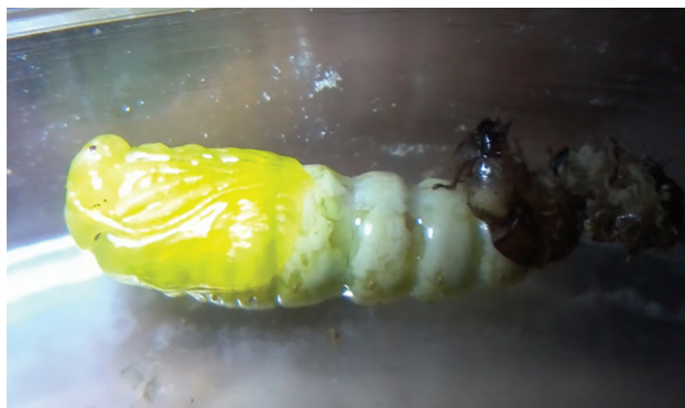
دقایقی پس از خروج شفیره Heliothis armigera از پوسته