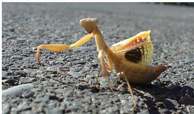
ژست شیخک برای دوربین