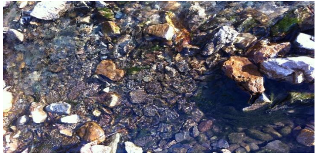
شکل ۲- شدت حضور جوامع جلبکی در نواحی آلوده رودخانه بوژان شهرستان نیشابور (چپ) در مقایسه با نواحی بالادست و سالم رودخانه خرو (راست)

و نیتروژن دار و همچنین برخی یون‌های فلزی مانند آهن سبب رشد بیش از حد جوامع جلبکی می‌شوند. این عناصر جز اساسی در رشد سلول‌های جلبکی و همچنین از عناصر پر مصرف در زیست توده آن‌ها به حساب می‌آیند. مقدار آهن و دسترسی به آن در محیط، یکی از پارامترهای محدودکننده رشد فیتوپلانکتون‌ها و جوامع جلبکی محسوب می‌شود. آهن می‌تواند در ارتباط با اسیدپتید آب، شدت گسترش جوامع جلبکی در محیط‌های آبی را تنظیم نماید. محیط‌های اسیدی ناشی از حضور ترکیبات سولفاته، فسفاته و نیتراته علاوه بر نقش مستقیم در تحریک رشد، سبب انحلال بیشتر آهن در آب و در نهایت رشد بیشتر سلول‌های جلبکی می‌شوند. نکته قابل توجه در این بحث عدم پاسخ برخی جمعیت‌های جلبکی به غلظت ترکیبات نیتروژن‌دار در آب می‌باشد؛ چرا که بسیاری از گونه‌های جلبکی خصوصاً انواع سیانوباکترهای هتروسیست‌دار قابلیت تثبیت نیتروژن را دارا می‌باشند.