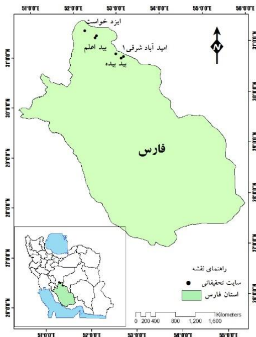
شکل ۱. موقعیت سایت‌های مورد مطالعه در استان فارس مشخصات سایت‌های مرتعی مورد مطالعه در جدول

این تحقیق در ۶ سایت استپی استان فارس در سال‌های ۱۳۷۷ تا ۱۳۸۶ انجام شد. با استفاده از بانک اطلاعات مراتع استان فارس سایت‌های ایزدخواست، امید آباد شرقی ۱، امید آباد شرقی ۲، بیابان‌زدایی، بید اعلم و بید بیده که از سایت‌های مورد بررسی در طرح ملی ارزیابی مراتع در مناطق مختلف آب و هوایی که در مؤسسه تحقیقات جنگل‌ها و مراتع کشور اجرا شده است، به عنوان جامعه آماری انتخاب گردید. موقعیت سایت‌ها در استان فارس در شکل (۱) و مشخصات سایت‌های مرتعی در جدول (۱) نشان داده شده است.