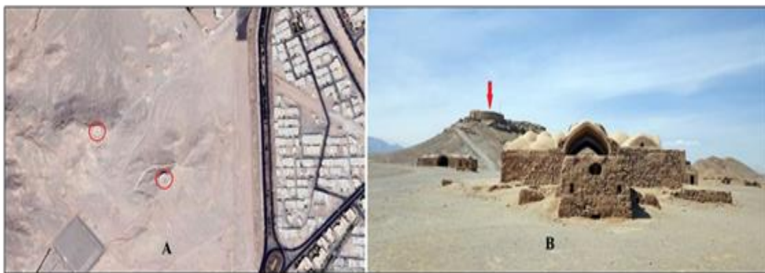
تصویر ۱: A. عکس هوایی دخمه‌های یزد: B. دورنمای دخمه یزد و مجموعه بناهای وابسته به آن (علی پور، ۱۳۸۵: ۱۳۱).

ه. آتشگاه: ساختمان کوچک خشتی-سنگی که تلفیقی از شکل مربع و نیم‌دایره است و دو سکوی نشیمن و پنجره‌ای که به جایگاه آتش منتهی می‌شود درون آن تعبیه شده است. در این قسمت، هنگام دخمه‌گذاری سیر و سداب می‌کردند و هر بار که یشت مخصوصی را می‌خواندند درون ظرف محتوی مواد، روغن می‌ریختند و دودی حاصل می‌شد. بنابر معتقدات ایشان، با هر بار دود کردن، پلیدی از جسد شخص دور شده و آلودگی‌ها نابود می‌شدند (همان: ۸۸).