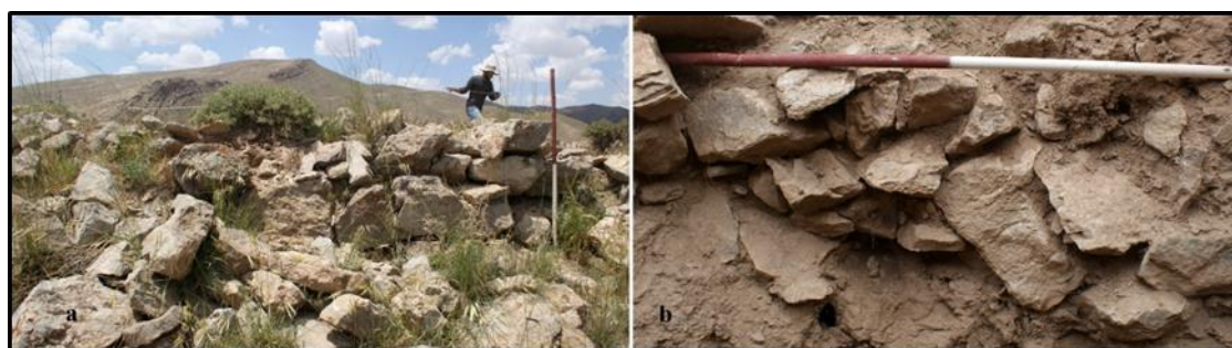
تصویر ۵: (A) دیوار بیرونی سازه زیزگان; (B) ساختارهای سنگی نمایان در چاله‌های حفاری غیرمجاز (نگارندگان، ۱۳۹۲).

با توجه به حجم وسیع آوار حاصل از تخریب سازه، وضعیت ورودی بنا قابل تشخیص نیست. متأسفانه در جای‌جای بخش درونی این بنا، حفاری‌های غیرمجاز گسترده‌ای صورت گرفته که همین امر در سطح وسیعی به تخریب آن انجامیده است. با این حال، درون برخی از چاله‌های مذکور، می‌توان بقایای ساختارهای سنگی که در گذشته داخل حصار مدور آن ایجاد شده بودند را شناسایی نمود (تصویر ۵). این ساختارها نیز به‌مانند سایر بخش‌های بنا، با استفاده از لاشه‌سنگ‌های کوچک و ملاط گل ایجاد گردیدند.