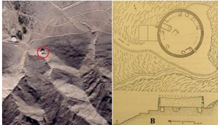
تصویر ۳: (A) عکس هوایی دخمه ری (Google Earth): (B) پلان و مقطع دخمه ری (Kleiss, 1987; 370)