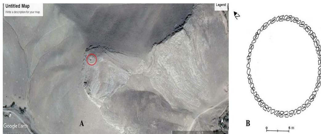
تصویر ۴: (A) عکس هوایی سازه زیزگان; (B) پلان سازه سنگی زیزگان (نگارندگان، ۱۳۹۲).

سازه سنگی زیزگان (Zizgan) در فاصله ۵۵ کیلومتری جنوب‌غربی شهر قم و ۳۰۰ متری شمال‌غربی روستای زیزگان، از توابع بخش خلجستان واقع شده است. این بنا، در جریان بررسی‌های میدانی نگارندگان در استان قم شناسایی و مورد مطالعه قرار گرفت. سازه مذکور بر روی کوهی نسبتاً بلند و مشرف به روستای زیزگان، با پلانی مدور به قطر تقریبی ۱۶ متر، با مصالح لاشه‌سنگ‌های بزرگ و کوچک و ملاط گل احداث شده است (تصویر ۴).