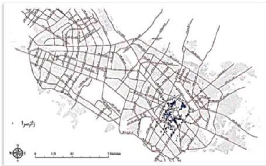
شکل ۲. نحوه پراکنش زائرسراهای اوقافی در سطح شهر مشهد

بر اساس اطلاعات اداره کل اوقاف خراسان رضوی، در حال حاضر تعداد زائرسراهای اوقافی این استان حدوداً ۲۹۵ مورد است. ۱ ملیت بیشتر مراجعه‌کنندگان ایرانی و از شهرهای مختلف ایران است، اما منحصراً زائرسراهایی برای افراد پاکستانی وجود دارد که تعداد آن‌ها اندک است و اداره اوقاف استان نظارت آن‌ها را بر عهده دارد. اسکان در این دسته از زائرسراها عمدتاً به صورت کاروان (گروهی) صورت می‌گیرد. ۸۰ درصد مراجعه‌کنندگان از نظر جنسیت مرد هستند. این زائرسراها فقط پذیرای میهمانان شیعه‌اند و از پذیرفتن افراد اهل تسنن و سایر مذاهب اجتناب می‌ورزند.