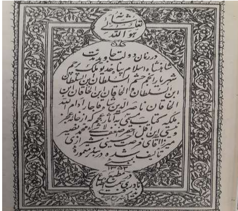
تصویر اول: تصویر صفحه اول کتاب تاریخ عجم، چاپ بمبئی، ۱۳۵۳ ق.