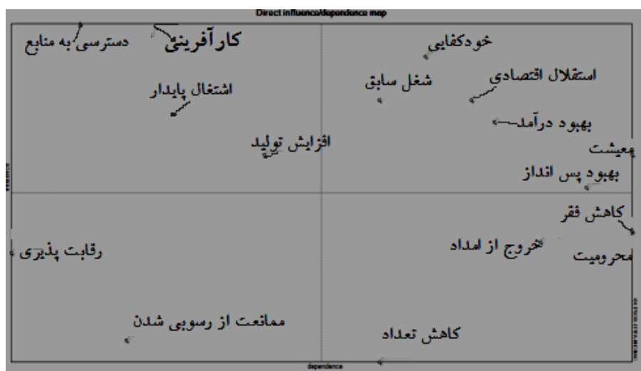
شکل ۱. نمودار تأثیرگذاری و تأثیرپذیری مستقیم تأثیرات مثبت اقتصادی استراتژی مرسوم توانمندسازی

به‌طور کلی ۲۵ شاخص به‌عنوان عوامل اولیه توسط خبرگان شناسایی شده و در قالب ماتریس‌هایی با ابعاد ۱۶×۱۶ و ۹×۹ نمود یافته‌اند.