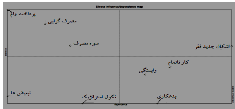
شکل ۳. نمودار تأثیرگذاری و تأثیرپذیری مستقیم تأثیرات منفی اقتصادی استراتژی مرسوم توانمندسازی

دووجهی یا تقویت کننده فقط شامل متغیر «شکل گیری اشکال جدید فقر و محرومیت» است. در بخش جنوب شرقی شکل ۳، متغیرهای ظهور وابستگی جدید، بدهکاری و ظهور کسب کارهای ناتمام فراوان به دلیل اندک بودن اعتبارات قرار گرفته اند و در بخش جنوب غربی متغیرهای قابل چشم پوشی قرار دارند که شامل گرایش های فریبکارانه ناشی از نکول استراتژیک (عدم بازپرداخت وامها) و افزایش تبعیض های درون جنسیتی و بین جنسیتی است. نتایج ذکر شده در شکل ۳ نشان داده شده است.