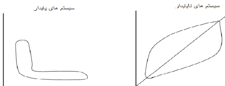
شکل ۵. سیستم پایدار و ناپایدار مأخذ: [۳۰]

در نمودارهای تأثیرگذاری و تأثیرپذیری مستقیم تأثیرات مثبت و منفی اقتصادی استراتژی مرسوم توانمندسازی، نحوه پراکنش و نظم متغیرها، نمایانگر پایداری و ناپایداری سیستم است. چنانچه متغیرها در داخل نمودار به شکل L باشند، سیستم پایدار است و این حالت از سیستم بیانگر ثبات در متغیرهای تأثیرگذار و تداوم تأثیر آن‌ها بر سایر متغیرهاست. اما اگر متغیرها از سمت محور مختصات به سمت انتهای نمودار و در حوالی آن پخش شده باشند، سیستم ناپایدار است و کمبود متغیرهای تأثیرگذار، سیستم را تهدید می‌کند [۳۰].