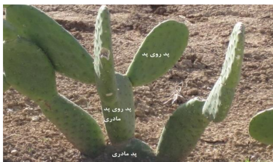
شکل ۲- نمایش پد روی پد مادری و پد روی پد

پد مادری)، میانگین تعداد پد روی پد (تعداد پد جدید روی پدهای روییده شده از پد مادری یا پدهای ثانویه) (شکل ۲)، طول پد، عرض پد، عملکرد علوفه‌تر، علوفه‌خشک و خوش‌خوراکی کاکتوس علوفه‌ای (غلظت عناصر کلسیم، منیزیم، پتاسیم، سدیم و فسفر در علوفه) بود. به‌منظور ارزیابی خوش‌خوراکی علوفه، تعداد ۱۰ نمونه از هر کرت به‌صورت تصادفی در دو مرحله نمونه‌برداری شد، تعداد ۱۰ نمونه در هر مزرعه برداشت شده (۱ کیلوگرم محصول) و برای ایجاد یک نمونه با هم مخلوط شدند و در کیسه‌های کاغذی قرار داده و به آزمایشگاه منتقل گردید. نمونه‌های محصول از اندام خوراکی برداشت و با آب مقطر شستشو داده شد، سپس نمونه‌ها در دمای ۷۵ درجه سانتی‌گراد به مدت ۴۸ ساعت قرار داده شد، تا به وزن ثابت برسد. نمونه‌ها پس از خشک شدن با استفاده از آسیاب برقی با محفظه تمام استیل آسیاب و نمونه‌های آسیاب شده تا زمان عصاره‌گیری در ظروف پلاستیکی که قبلاً با اسید رقیق شسته شده نگهداری گردید. ۲ گرم از هر نمونه توزین و به‌منظور تعیین غلظت کلسیم (Ca)، پتاسیم (K)، منیزیم (Mg)، سدیم (Na) و فسفر (P)، سر موجود در نمونه‌ها با روش اکسیداسیون تر توسط \text{HNO}_3 و \text{H}_2\text{O}_2 هضم (Demirak et al., 2006) و توسط دستگاه‌های جذب اتمی و کوره گرافیتی (ICP-AES) اندازه‌گیری شدند (Li et al., 2004).