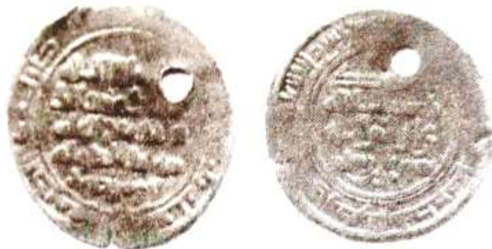
شکل شماره ۱۳: سکه مربوط شهریار بن رستم محل ضرب: فریم، سال ۳۷۳ (ق.ه) از جنس درهم بیلون (رضایی باغ بیدی، ۱۳۹۳: ۴۷۶)

۵- سکه‌ای مربوط شهریار بن رستم از جنس نقره بیلون، محل ضرب آن فریم و سال ضرب آن ۳۷۳ (ق.ه) به شرح ذیل است. در قسمت وسط سکه «لا اله الا الله، المک عضدالدوله و تاج المله، مؤید الدوله ابومنصور، وحده لا شریک له، الطائع له، شهریار بن رستم» حاشیه اول روی سکه «بسم الله، ضرب هذا الدرهم بفریم سنه ثلاث و سبعین و ثلاثمائه» پشت سکه «الله، محمد رسول الله، علی ولی الله، شهریار بن رستم» و حاشیه پشت سکه: «محمد رسول الله ارسله بالهدی و دین الحق لیظهره علی الدین کله و لو کره المشرکون» نوشته شده است.