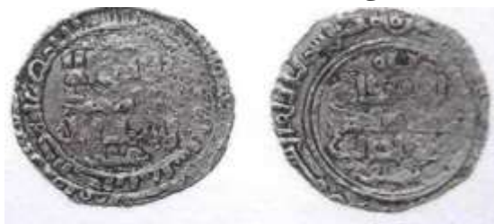
شماره ۱۴: سکه مربوط شهریار بن رستم محل ضرب: ساری، سال نامشخص از جنس دینار (رضایی باغ بیدی، ۱۳۹۳: ۴۷۷).

فخرالدوله و فلک‌الامه بن رکن‌الدوله» و حاشیه پشت سکه: «محمد رسول‌الله ارسله بالهدی و دین الحق لیظهره علی الذین کله و لوکره المشرکون» نوشته شده است. ۷- سکه‌ای مربوط علی بن شهریار از جنس نقره، محل ضرب آن ساری و سال ضرب آن نامشخص به شرح ذیل است. در قسمت وسط سکه «لا اله الا الله، محمد رسول‌الله، علی» حاشیه اول روی سکه «بسم‌الله، ضرب هذا الدرهم بسلویه...» پشت سکه «الله، الراشد بالله، السلطان الاعظم ابوالحارث سنجر» و حاشیه پشت سکه: «محمد رسول‌الله ارسله بالهدی و دین الحق لیظهره علی الذین کله و لوکره المشرکون» نوشته شده است.