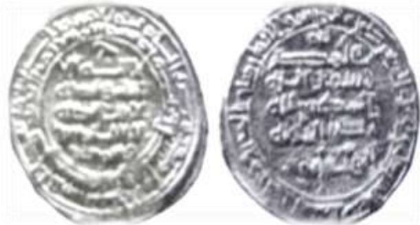
شکل شماره ۸: سکه مربوط بیستون بن وشمگیر، محل ضرب ساری، سال ۳۵۸ (ق.ه) از جنس دینار (رضایی باغ بیدی، ۱۳۹۳: ۴۸۳)