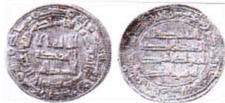
شکل شماره ۶: سکه اموی مربوط طرفداران عبدالله بن معاویه محل ضرب: ماهی سال ضرب ۱۲۷ (ق.ه) از جنس درهم (رضایی باغ بیدی، ۱۳۹۳: ۱۲۴)

الموده فی القربی» (سوره شوری، بخشی از آیه ۲۳) نوشته شده است؛ اما متن پشت سکه همانند سکه های اموی «الله احد الله الصمد لم یلد و لم یولد و لم یکن له کفوا احد» و حاشیه آن «محمد رسول الله ارسله بالهدی و دین الحق لیظهره علی الدین کله و لو کره المشرکون» نوشته شده است. سکه های عبدالله بن معاویه تا سال ۱۳۰ (ق.ه) توسط طرفدارانش ضرب می شده است.