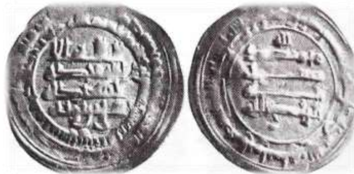
شکل شماره ۹: سکه مربوط عمادالدوله، محل ضرب شیراز، سال ۳۲۲ (ق.ه) از جنس درهم (رضایی باغ بیدی، ۱۳۹۳: ۵۰۸)