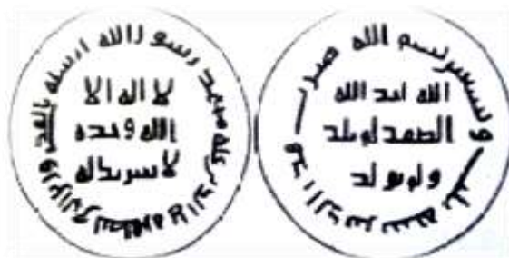
شکل شماره ۴: طرح دینار اموی، ضرب سال ۹۳ (ق.ه) مربوط به ولید بن عبدالملک (رضایی باغ ببیدی، ۱۳۹۳: ۹۵)

«عین» و «وَرَق» اشاره کرد که به ترتیب به معنی زر مسکوک و نقره مسکوک بوده است (زمخسری، ۱۸۳۴. م - ستار زاده، ۱۳۸۹: ۴۳۱ - ۵۹۰). واژه ورق در قرآن کریم (۶) نیز به کار رفته است. وزن دینار ابتدا حدود ۴/۲۶-۴/۲۵ گرم (برابر با یک مثقال) و درهم حدود ۲/۸۵ گرم وزن داشت. بر روی سکه‌های اموی، در متن عبارت «لا اله الا الله وحده/ لا شریک له» و در حاشیه جمله «محمد رسول الله ارسله بالهدی و دین الحق لیظهره علی الدین کله و لو کره المشرکون» درج گردیده است. در متن پشت سکه «الله احد الله/ الصمد/ لم یلد/ و لم یولد» در حاشیه آن « بسم الله ضرب هذا لدینار فی سنه ... یا بسم الله ضرب هذا الدینار سنه ...» ضرب گردیده است. یکی از ویژگی‌های مهم سکه‌های اموی آن است که نام خلیفه بر روی آن نوشته نشده و از روی تاریخ ضرب آن می‌توان خلیفه زمان ضرب سکه را شناسایی کرد.