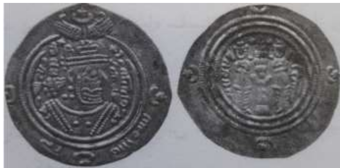
شکل شماره ۳: سکه عرب - ساسانی مربوط به خسرو پرویز، محل ضرب نپاوند، سال ۳۰ یزدگردی (۴۱ ه.ق.) (ر.ک. رضایی باغ بیدی: ۱۳۹۳)

عباراتی چون «برکه» «بسم الله» «جید» (۴) ، «الله» و «الله الحمد» نوشته شده و در پشت آنها نیز نقش آتشدان ساسانی با دو نگهبان تصویر شده است. نامه ضرابخانه در سمت راست و تاریخ ضرب نوشته شده است. همچنین در کنار آتش درون آتشدان هلال و ستاره‌ای دیده می‌شود که معمولاً هلال در سمت راست و ستاره در سمت چپ آتش است. پژوهش‌ها نشان می‌دهد که وزن سکه‌های خسرو با واژه «أقد» بیشتر از سکه‌های او بدون این واژه است، همچنین سکه‌هایی که در حاشیه آنها «الله» نوشته شده نسبت به سکه‌های دیگر اندکی خالص‌تر یا سنگین‌تر هستند.