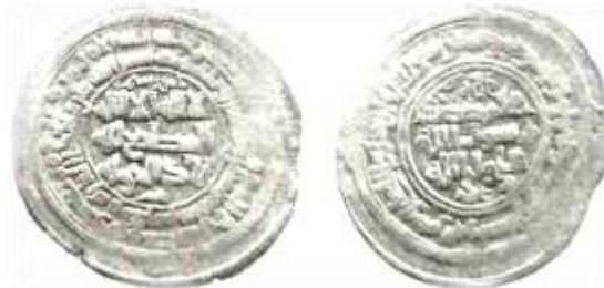
شکل شماره ۱۲: سکه مربوط رستم بن شروین محل ضرب: فریم، سال ۳۶۵ (ق.ه) از جنس درهم (رضایی باغ بیدی، ۱۳۹۳: ۴۷۵).

۵- سکه‌ای مربوط شهریار بن رستم از جنس نقره بیلون، محل ضرب آن فریم و سال ضرب آن ۳۷۳ (ق.ه) به شرح ذیل است. در قسمت وسط سکه «لا اله الا الله، المک عضدالدوله و تاج المله، مؤید الدوله ابومنصور، وحده لا شریک له، الطائع له، شهریار بن رستم» حاشیه اول روی سکه «بسم الله، ضرب هذا الدرهم بفریم سنه ثلاث و سبعین و ثلاثمائه» پشت سکه «الله، محمد رسول الله، علی ولی الله، شهریار بن رستم» و حاشیه پشت سکه: «محمد رسول الله ارسله بالهدی و دین الحق لیظهره علی الدین کله و لو کره المشرکون» نوشته شده است.