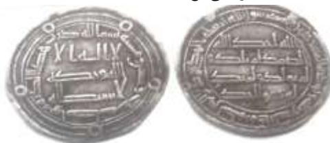
شکل شماره ۵: سکه اموی مربوط ولید بن یزید، محل ضرب: واسط سال ضرب ۱۲۶ (ق.ه) از جنس درهم (وثیق، ۱۳۸۷: ۴۷)

در اواخر حکومت امویان، سکه‌های عبدالله بن معاویه بن عبدالله بن جعفر بن ابی‌طالب (ع) که از آنها به‌عنوان سکه شورشیان یاد می‌کنند، ضرب گردید. برخی از مورخین نیز قیام عبدالله بن معاویه را قیام شیعی و سکه‌های او را نخستین سکه‌های شیعی می‌دانند. بر متن روی سکه‌های درهمی و فلوسی (مسی) جعفر عبارت «لا اله الا الله، وحده لا شریک له» و در حاشیه آن شعار طرفداران خاندان پیامبر (ص) «قل لا اسئلكم علیه اجراً الا