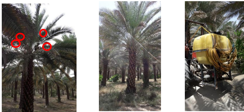
شکل ۲. سمپاش لانس دار پشت تراکتوری (راست)، لانس و بوم ۴ متری (وسط)، محل نصب کارت‌های حساس (چپ)