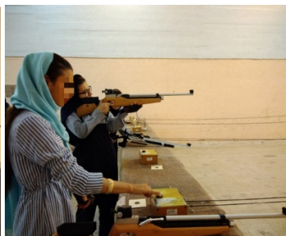
شکل ۱. شرکت‌کنندگان در حال شلیک به سبیل در جلسه دوم