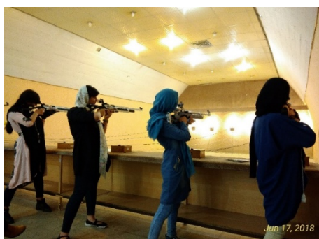
شکل ۲. شرکت‌کنندگان در حال اجرای «شلیک استقامتی بعد از یک دقیقه» در جلسه نهم