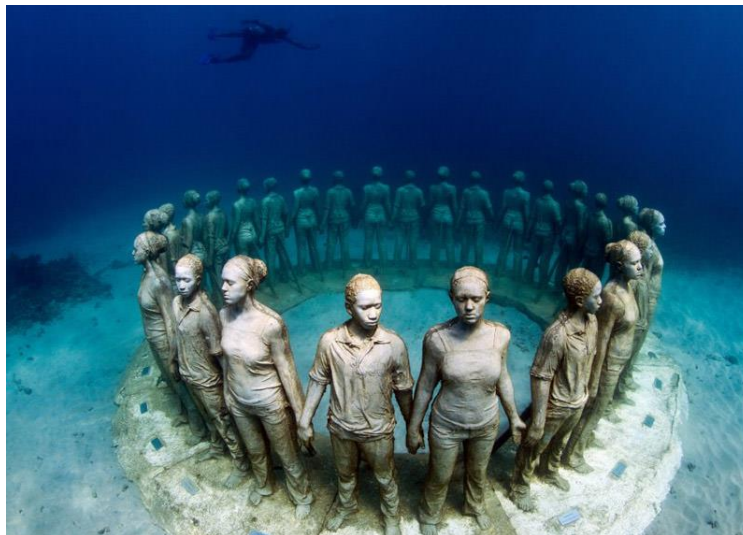
شکل ۹ و ۱۰. موزه زیر آب، مجموعه رویاها، ۲۰۱۳

آن حرکت کند. نمایش انسان معاصر در حالت تنهایی و انزوا و تنهایی در جمع در مجسمه‌ها دیده می‌شود. او برای بیان ایده‌ها و دغدغه‌های خود از مجسمه‌های انسان‌های واقعی در اندازه و حالت‌های واقعی بهره گرفته است و انسان معاصر می‌تواند با آن همذات‌پنداری کند. او چهره جدیدی از مجسمه‌سازی معاصر در هنر پسامدرن را به نمایش گذاشته است. آثار او بازتاب دنیای معاصر است؛ جهانی وارونه که در زیر آب ساخته شده است. انسان‌هایی که به شکل و اندازه واقعی در برش‌ها و لحظه‌هایی از زندگی مسخ شده‌اند و بی‌تفاوتی و بی‌هویتی انسان معاصر را نشان می‌دهند. در آثار تیلور انسان به مثابه شیء واقعی، تکثیر شده است. در این آثار انسان، در دنیایی که از واقعیت الهام گرفته شده، به صورت مجسمه‌هایی در اندازه واقعی، برای وارونه جلوه دادن دنیای واقعی معاصر به کار رفته است.