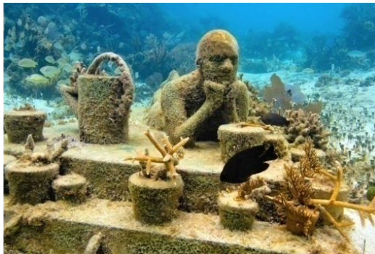
شکل ۵ و ۶. موزه زیر آب، مجموعه رویاها، ۲۰۱۳.

دنیای واقعی است و به شی‌وارگی انسان برای تخریب انسان و طبیعت تأکید شده است. ساختار مجسمه‌های تیلور با خصیصه‌های واقعی انسانی «خودبیگانگی انسان در دوره معاصر» مشابه است. در این آثار انسان به مثابه شی به کار رفته است و رابطه میان انسان‌ها به رابطه میان اشیا بدل شده است. انسان در حد یک شی یا کالا در ساختار جامعه معاصر تلقی می‌شود. تکراری و هم شکل بودن انسان‌ها بر این امر تأکید دارد. یکی از مهم‌ترین ویژگی‌های انسان‌های تیلور به عنوان برساختی از اجتماع و یک سوژه مدرن بدون هویت است که به شی‌وارگی رسیده است. انسان به صورت یک کالای سرمایه‌داری جایگاهی همانند شی پیدا کرده است. در آثار او مرز بین واقعیت انسان معاصر و انسان به مثابه یک کالا یا شی مطرح شده است. انسان در این آثار دچار جدا شدن از واقعیت و عدم درک آن شده و انسان را به عنوان یک شی واره طبیعی نشان می‌دهد که معنای ثانوی طبیعت را باز می‌تاباند. انسان در این آثار به صورت فراواقعیت یا واقعیت حاد با تأثیر پذیری از نشانه‌های فلسفه پست‌مدرن تصویر شده است تا عدم توانایی انسان در مرز بین واقعیت و خیال را نشان دهد. در فرهنگ پست‌مدرن فراواقعیت مفهومی برای تفسیر انسان است که باید واقعیت‌های گوناگون استفاده کند و جهان معاصر را کشف و درک کند. انسان در آثار تیلور دچار خودبیگانگی، تنهایی، گسست انسان معاصر است که با نظریات بودریار در مورد پسامدرن تطبیق دارد.