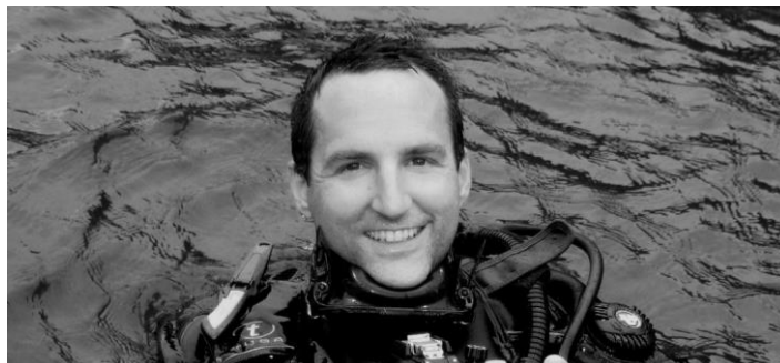
شکل ۱. جیسون دیکرز تیلور در سال ۲۰۱۶

است. در آثار تیلور مهم‌ترین ویژگی استفاده از پیکره‌های انسانی در اندازه‌های واقعی به صورت اشیایی منجمد هستند و اشباح انسانی در شهری وارونه در زیر آب را نمودار می‌سازند.