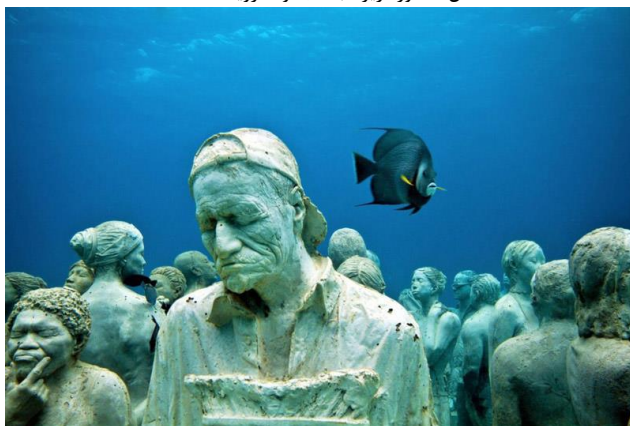
شکل ۷. موزه زیر آب، مجموعه رویاها، ۲۰۱۳