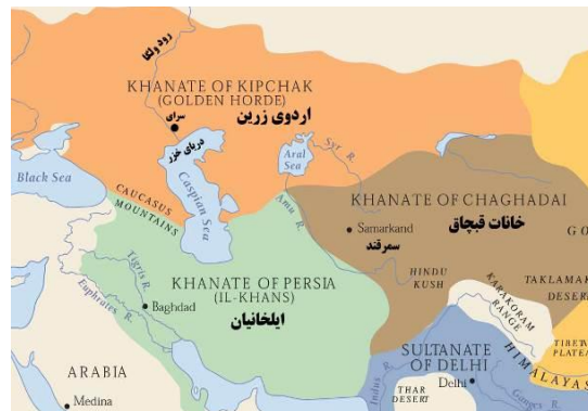
تصویر ۱۴- بخشی از قلمرو مغولان در ابتدای قرن هشتم هجری.

در رابطه با وجود اشعار فارسی بر آثار هنری اردوی زرین از جمله برخی سفالینه‌های لاجوردینه چندین احتمال مطرح شده است. یکی آن که به دلیل ارتباطات سیاسی میان دو حکومت اردوی زرین و ایران، این مناطق از لحاظ فرهنگی به یکدیگر نزدیک شده بودند. دیگر آن که اغتشاشات سیاسی خراسان در نیمه قرن هشتم هجری، انگیزه حرکت صاحبان تخصص به سمت مراکز ولگای جدید بود که پروژه‌های ساختمانی و سفارشات کاری بیش‌تری داشتند (ibid, 251). بنا بر شواهد بدست آمده، میان بازرگانان جنوای ایتالیا و ساکنان اردوی زرین، مراودات تجاری مستحکمی برقرار بوده است و حمل اشیاء بلورین و سفالین از دریای سیاه و مدیترانه شرقی بسوی مصر