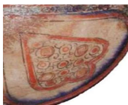
تصویر ۳- نمای نزدیک از تزئینات کاسه لاجوردینه.