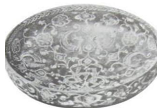
تصویر ۹- کاسه منقوش زراندود.