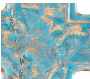
تصویر ۶- جزئیات کاشی با نقش پرند.