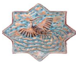
تصویر ۲- کاشی با نقش سیمرغ.