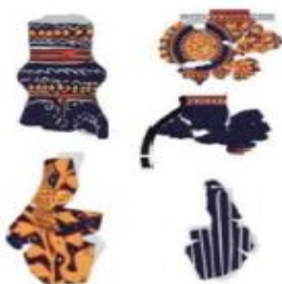
تصویر ۱۰- طرح برخی ظروف شکسته اکتشافات حسنلو.

در زمان ایلخانیان که ساخت کاشی‌های ستاره‌ای، صلیبی، کتیبه‌ای و محرابی متداول بود، برجسته‌کاری سطح کاشی نیز