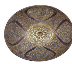
تصویر ۱- کاسه لاجوردینه با نقوش هندسی.