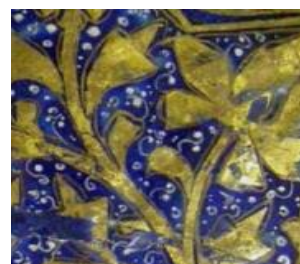
تصویر ۵- جزئیات یک کاشی لاجوردینه.