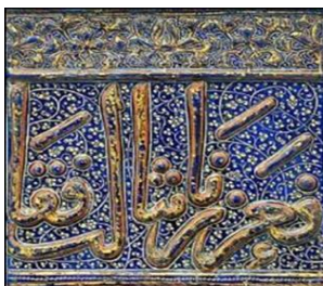
تصویر ۷- کاشی کتیبه‌ای لاجوردینه.