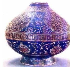
تصویر ۱۷- نمونه لاجوردینه اردوی زرین با تزئینات هندسی. مأخذ: (Haddon, 2011, v2, 126) تصویر ۱۸- ظرف مکشوفه از اردوی زرین. مأخذ: (Ibid, 126)