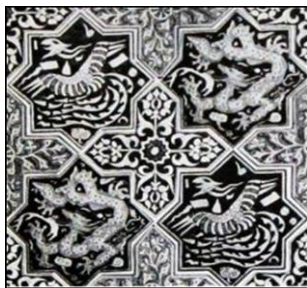
تصویر ۱۲- ترتیب پیشنهادی برای برخی کاشی‌های تخت سلیمان. مأخذ: (Morgan, 1995, 26)

مکاتبات این وزیر نامدار ایلخانی تحت عنوان سوانح‌الافکار رشیدی و به همت شمس‌الدین محمد ابرقوئی گردآوری شده است. در نامه‌ای با عنوان "مکتوب که ملک علاءالدین از هندوستان در جواب مکتوب به خواجه رشیدالدین نوشته است" و به سال ۷۰۸ هجری تاریخ‌گذاری می‌شود، سوغات ارسالی از طریق بصره برای خواجه رشیدالدین با جزئیات تشریح شده‌اند. بخشی از این هدایا، ظروف طلا و چینی معرفی شده با لفظ «صینی» می‌باشند و مشتمل بر انواع قاب، قدح و بشقاب لاجوردی رنگ، کاسه بزرگ با نقش برجسته، جام هفت رنگ، ظروف مکعب و صراحی لاجوردی تحریر شده به طلا هستند (همدانی،