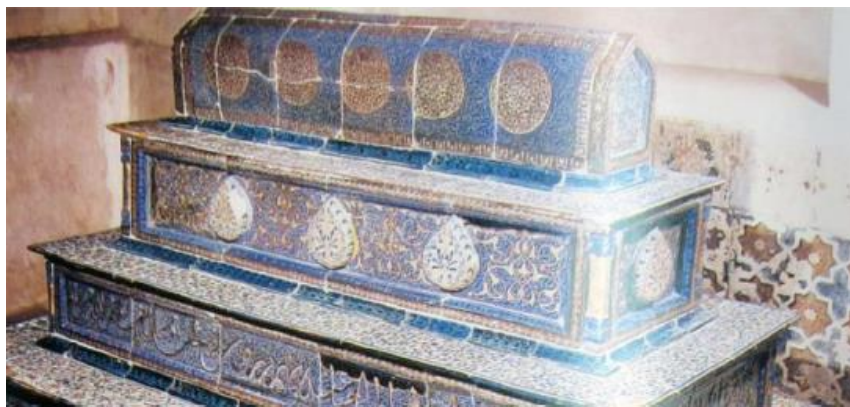
تصویر ۱۳- کاشی‌های لاجوردینه در آرامگاه پله‌ای مقبرهٔ قثم بن عباس، سمرقند.