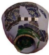
تصویر ۱۵- نمای بیرونی کاسه تصویری ۱۶- قطعه‌ای از ظرف لاجوردینه یافت شده از اردوی زرین. مکشوفه از قزاقستان. مأخذ: (Haddon, 2011, v2, 126) (Ibid, 128)