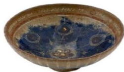
تصویر ۴- کاسه لاجوردینه، قرن هشتم.

با وجود آنکه کاشانی به طور کلی در خصوص زرانودسازی سفالینه‌ها سخن می‌گوید، توضیحات وی در شناساندن شیوه طلاکاری سفال آن عصر از جمله سفال‌های لاجوردینه بسیار مفید است. به نقل از کاشانی «اگر خواهند که آلات شفاف و مصمت هر دو ملاحظا کنند، یک مثقال زر سرخ به بیست و چهار ورق بکوبند و در میان کاغذی نهند به حص مالیده و به وشق محلول بر آلات به قلم می‌چسبانند و به پنبه هموار می‌کنند...» (همان، ۳۴۷). معادل امروزی این متن را می‌توان اینگونه تفسیر کرد: اگر بخواهند سفالینه‌های لعابدار شفاف یا مات را زرانود کنند، یک مثقال طلای سرخ را به اندازه‌ای می‌کوبند که از آن ۲۴ ورق طلا حاصل شود. این اوراق را در میان کاغذهای گچ‌آلود قرار می‌دهند و با محلول چسب گیاهی و به کمک قلم بر اشیاء می‌چسبانند. پس از آن طلای متصل شده را با پنبه صیقل می‌دهند.