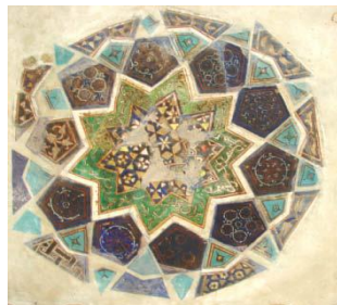
تصویر ۱۹- کاشی‌های لاجوردینه و چند رنگ یافت شده از سرای پایتخت باتو. مأخذ: (Ibid, 128) تصویر ۲۰- کاشی لاجوردی زرانود، مجموعه شاه زنده. مأخذ: (Kobendau, 1997, 381)

عبارت عربی "لعافیه" به معنای برای سلامتی معنا می‌شود که پیش از این به نمونه مشابهی از کاربرد آن در سمرقند اشاره شد. روی بدنه ظرف دیگری از اردوی زرین که سطح داخلی آن با لعاب فیروزه‌ای و خارج آن با لعاب لاجوردی پوشانده شده است، متن شعری فارسی با ورق طلا مشاهده می‌شود (تصویر ۱۸). لاجوردینه‌های یافت شده در این نواحی، به سده‌های هفتم و هشتم هجری نسبت داده می‌شوند. یک پانل کاشی مرکب از سفال لاجوردینه و چند رنگ از اکتشافات شهر سرای بدست آمده است (تصویر ۱۹). تاکنون کوره‌های تولید لاجوردینه در این نواحی یافت نشده است و بدون وجود شواهد کافی، تعیین محل ساخت این آثار با مشکل مواجه می‌شود.