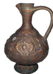
تصویر ۸- ابریق برجسته با نقوش زراندود، قرن ششم و هفتم هجری.