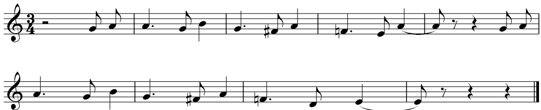
تصویر ۶- سکوننس در فاصله چهارم و ایست روی چهارم بالای شاهد.

۲. نگرش کنترپوانی نسبت به خطوط، استقلال بخش‌ها در قالب حرکات مخالف و کنترمدال در تشخیص بخشیدن به گوشه‌ها؛