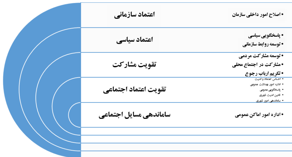
شکل ۲. شبکه مضامین یافته‌های تحقیق