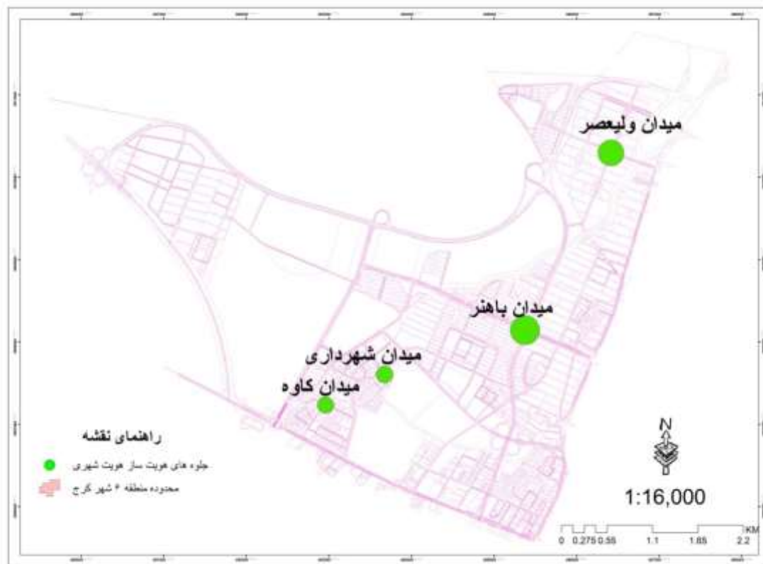
نقشه ۱. منطقه بندی و حریم منطقه ۶ شهر کرج

این منطقه از شمال به ارتفاعات باغستان، از جنوب به بلوار شهید بهشتی حوزه شهرداری منطقه ۵، از شرق به بلوار باغستان و حوزه شهرداری منطقه ۷، از غرب به اتوبان تهران - قزوین و کمال شهر متصل است.