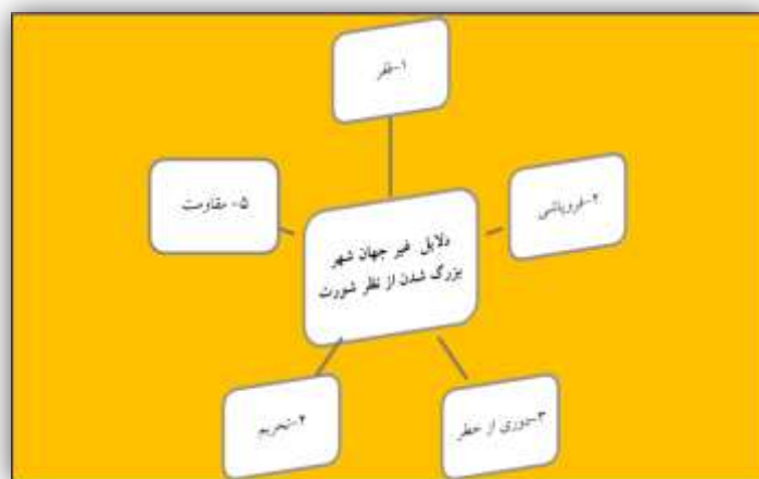
شکل ۲. دلایل غیر جهان شهر بودن از نظر شورت

بنابراین، جایگاه غیرجهان شهری تا حد زیادی بازتاب فقر است. برخی شهرها، به‌رغم اندازه‌شان، چنان فقیرند که بازاری برای خدمات تولیدگر پیشرفته عرضه نمی‌کنند. آن‌ها، با توجه به جمعیت بسیار زیاد، اما نبود مصرف‌کنندگان مرفه یا مجموعه‌های صنعتی برای پشتیبانی از خدمات تولیدگر پیچیده سیاه‌چاله‌های سرمایه‌داری پیشرفته جهانی‌اند. بنا بر تعریف بانک جهانی، هشت شهر از یازده شهر (جدول ۳) در کشورهایی با درآمد پایین و سه شهر (تهران، بغداد، و الجزیره) در مقوله درآمد پایین تا متوسط قرار دارند. بانک جهانی کشورها را بر اساس درآمد سرانه ناخالص ملی در چهار مقوله رده‌بندی می‌کند: پایین، پایین تا متوسط، بالاتر از متوسط و بالا. همگی شهرهای این جدول در دو مقوله پایینی‌اند. ارزش‌های مطلق ۱ سرانه درآمد ناخالص ملی در جدول ۴ نشان داده شده است. این شهرها در برخی از فقیرترین کشورهای جهان قرار دارند. کینشازا پایتخت کنگویی است که سرانه درآمد ناخالص ملی آن در سال ۲۰۰۰ رقم رقت‌انگیز ۱۱۰ دلار بود.