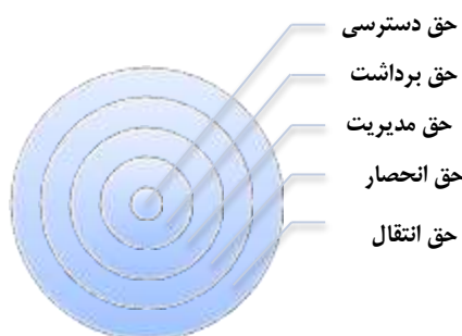
شکل ۳. انواع پنج‌گانه حقوق مالکیت (استرم، ۲۰۰۳: ۲۵۰)