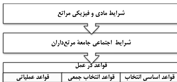
شکل ۱. سطوح اثرگذاری شرایط مادی و اجتماعی بر قواعد در عمل (حسینی، ۱۳۹۳: ۷۵)

یکی از رویکردهای نوین و دقیق در تعریف و تحلیل حکمرانی تحلیل نهادی است. در این رویکرد پدیدهٔ مورد بررسی به‌عنوان یک نهاد اجتماعی مورد مذاقه قرار می‌گیرد. در رویکرد نهادی با تعاریف و جریان‌های مختلفی روبه‌رو هستیم. نهادهای اجتماعی- چه به‌عنوان نظامات و قواعد بیرون از افراد معنابخشی شده باشند چه به‌عنوان عادات ذهنی پایدار و شناخت‌های مشترک‌شده شناخته شوند- یکی از عناصر کلیدی مؤثر بر رفتار افراد در موقعیت‌های مختلف‌اند. شاید در تعریفی ساده بتوان نهادها را نرم‌افزار سازمان‌دهی تعاملات انسانی ترجمه کرد (کیسر ۳ و استرم، ۱۹۸۲). استرم مبتنی بر سال‌ها تحقیق در این حوزه الگوی جامعی برای کالبدشکافی و فهم محتوای نهادها با عنوان چارچوب تحلیل و توسعهٔ نهادی ۴ (IAD) ارائه کرده است. وی در این الگو تلاش کرده تا با در نظر گرفتن تنوع موقعیت‌ها و ناظر به مسئله منابع مشترک و قواعد شکل‌دهندهٔ موقعیت‌های کنش در نهادها به بحث و نظریه‌پردازی در این زمینه بپردازد (استرم، ۲۰۰۵).