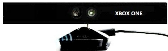
شکل ۱. تصویر شماتیک کینکت ایکس باکس ۱

۴+ از مقیاس تعدیل شده اشورث (۳)، آسیب‌های جراحی سر، ۴. نقص بینایی و شنوایی، ۵. عقب‌ماندگی ذهنی متوسط تا شدید و ۷- بیماری صرع که می‌تواند به واسطه نور ال سی دی تحریک شود. دستگاه ایکس باکس ۳ با رزولوشن تصویر ۱۰۸۰×۱۹۲۰ مجهز به پنج پورت یو اس بی، ۴ یک پورت مخصوص کینکت ۵ خروجی‌های اچ دی ام آی، ۷ خروجی تاسلینک ۸ و همچنین شبکه بی‌سیم وای فای به منظور انجام تمرینات واقعیت مجازی استفاده شد.