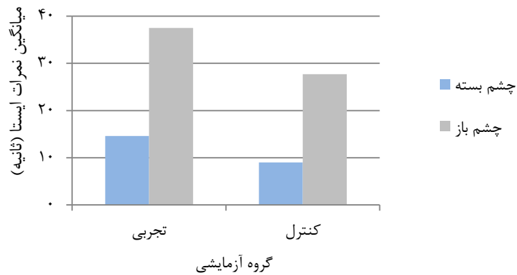
شکل ۴. میانگین نمرات تعادل ایستا در مرحله پس آزمون

نتایج آزمون شاپیرو ویلکز در تمامی متغیرها حاکی از نرمال بودن توزیع داده‌های پیش‌آزمون متغیرهای مورد مطالعه بود. همچنین، نتایج آزمون لون در مرحله پس‌آزمون متغیرهای تعادل ایستا با چشم بسته (F(1,18) = 3/41, P = 0/081) و تعادل ایستا با چشم باز (F(1,18) = 3/82, P = 0/066) معنادار نشد (P > 0/05) که نشان‌دهنده همگنی واریانس‌ها بود. نتایج آزمون M باکس نیز حاکی از برابری ماتریس‌های کوواریانس در بین متغیرهای وابسته در مرحله پس‌آزمون بود (F(3, 5/83) = 0/41, P = 0/743) .