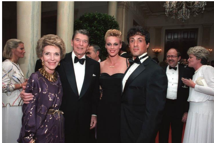
شکل ۱. سیلوستر استالونه به همراه بریتی نیلسن، ۱ رونالد ریگان و نانسی ریگان در کاخ سفید، سال ۱۹۸۵.

موفقیت فیلم رامبو که چند ماه پیش از چهارصد هزار دلار به فروش رفت، افزون بر خلاقیت هنری و قدرت اقتناع آن، به سبب حمایت‌های کاخ سفید نیز بود. رامبو نیز با بازنمایی فضاهای روسی، به مثابه مکان‌هایی سراسر تنش‌زا و بحران‌آفرین و با مردمانی بدون عقلانیت، اهریمنی و خشن، دوآلیسم ما و آن‌ها و ژئوپلیتیک تنش را در میان توده آمریکایی‌ها رواج داد. در همه این فیلم‌ها و به‌ویژه رامبو، گریزی جز «تنش همیشگی» وجود ندارد (Ross, 2011: 71).