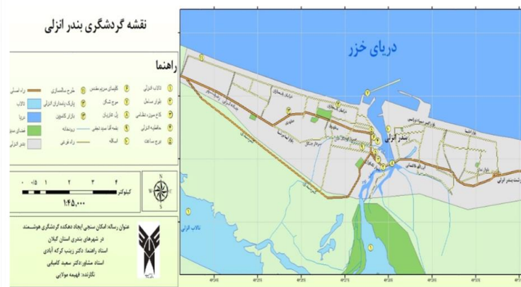
شکل شماره ۱. نقشه گردشگری بندر انزلی

بندر انزلی اولین و بزرگ‌ترین بندر سواحل جنوبی دریای خزر در منطقه‌ای جلگه‌ای و ساحلی در طول جغرافیایی ۴۹ درجه و ۲۸ دقیقه و عرض جغرافیایی ۳۷ درجه و ۲۸ دقیقه واقع شده است و ارتفاع آن از سطح دریا ۲۶- متر می‌باشد. این شهرستان از شمال به دریای خزر، از جنوب به تالاب انزلی، از مشرق به رشت و از مغرب به منطقه طوالش (شهرستان رضوانشهر) محدود می‌شود. در فاصله ۴۰ کیلومتری شهرستان رشت (مرکز استان گیلان) و در منطقه‌ای معتدل واقع شده است و از لحاظ بارندگی یکی از پر باران‌ترین مناطق کشور محسوب می‌شود. شهر بندر انزلی از دو قسمت انزلی و غازیان تشکیل شده است که به وسیله کانال موجود بین این دو قسمت، آب چهار رودخانه - از شرق (سوسر روگا، پیر بازار روگا، راست خانه، نهنگ روگا) و یک رودخانه از غرب (شنبه بازار روگا) - وارد دریا می‌شود. جمعیت شهرستان بندر انزلی بر اساس آمار سال ۱۳۹۵ برابر با ۱۳۹۰۱۶ نفر می‌باشد که ۱۱۸۵۶۴ نفر آن جمعیت شهری است. مساحت شهرستان نیز بالغ بر ۲۹۹ کیلومتر مربع و ۳۳ کیلومتر مربع آن به مساحت شهری اختصاص یافته و از این نظر بندر انزلی از متراکم‌ترین شهرهای ایران محسوب می‌گردد. (سازمان جغرافیایی، ۱۳۹۲: ۲۱۱).